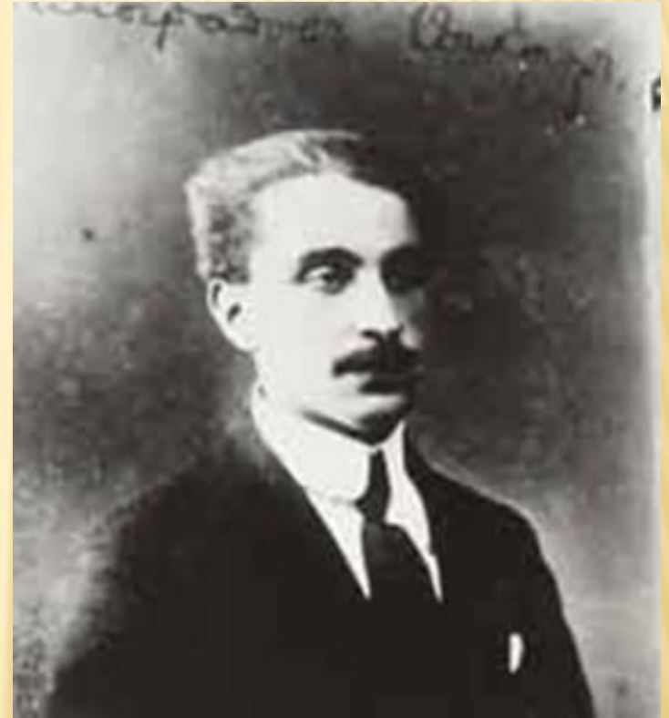
Фотография В.В. Виноградова университетского периода