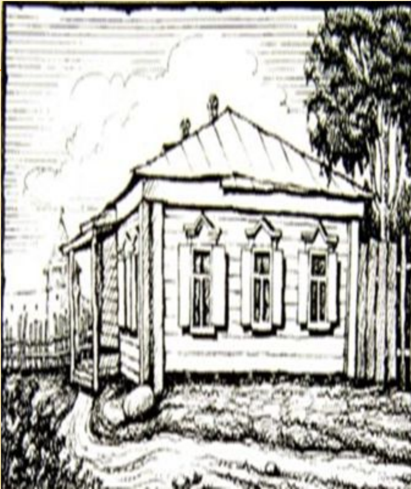
Дом в Зарайске, где родился учёный