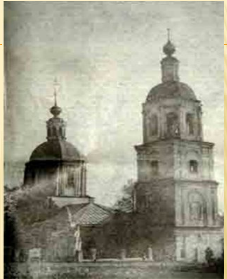
Троицкая церковь, где служил отец