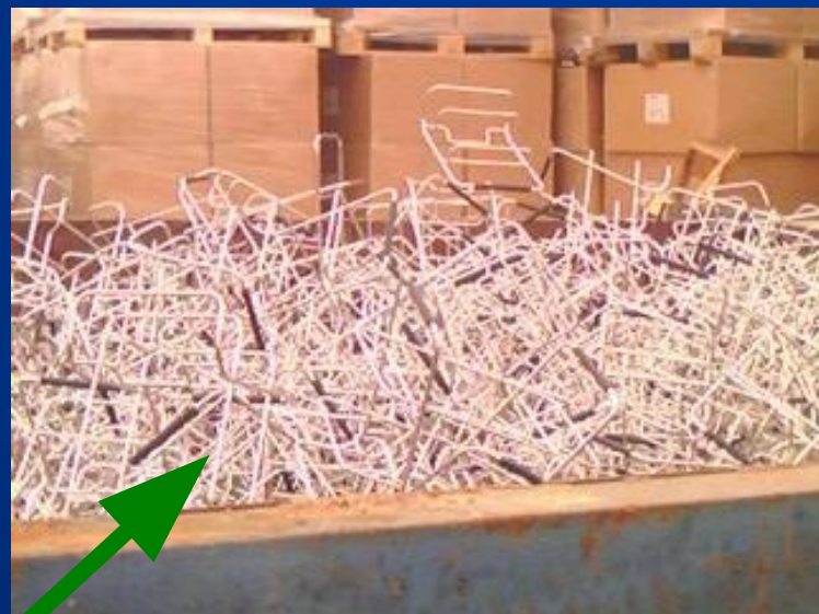
Металл с иными компонентами (пластик и т.д.)