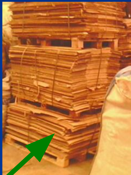
Картон, бумага - макулатура