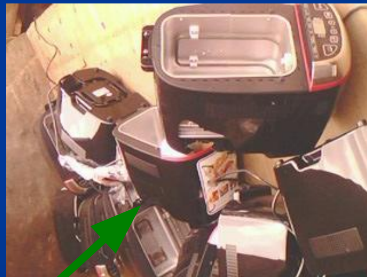
Сложная бытовая техника, оргтехника