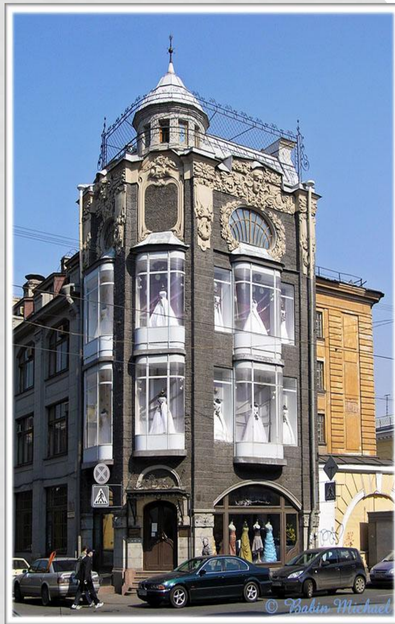
Лавка И. А. Алферова

На стенах – звериные морды, Русалки с улыбкой усталой – Как накипь на стенах реторты, Как варево века вскипало.