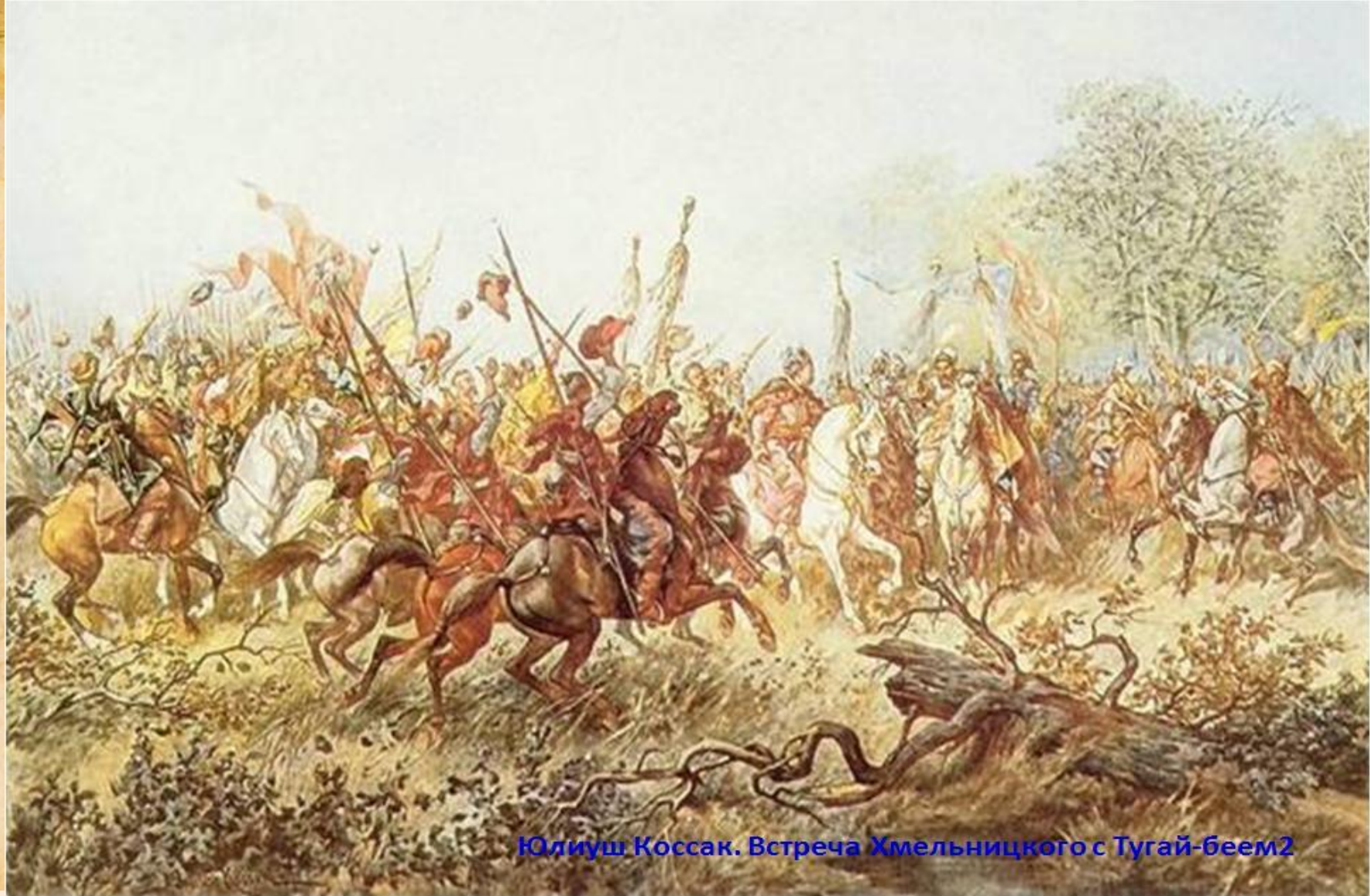
Юлиуш Коссаk. Встреча Хмельницкого с Тугай-беем2

Польская шляхта, турки, захватывающие и продающие в плен людей, татарские полчища – со всеми ними вело борьбу украинское казачество. Защита национальной независимости, государственной самостоятельности часто была неотделима от борьбы за веру, за утверждение православной церкви.