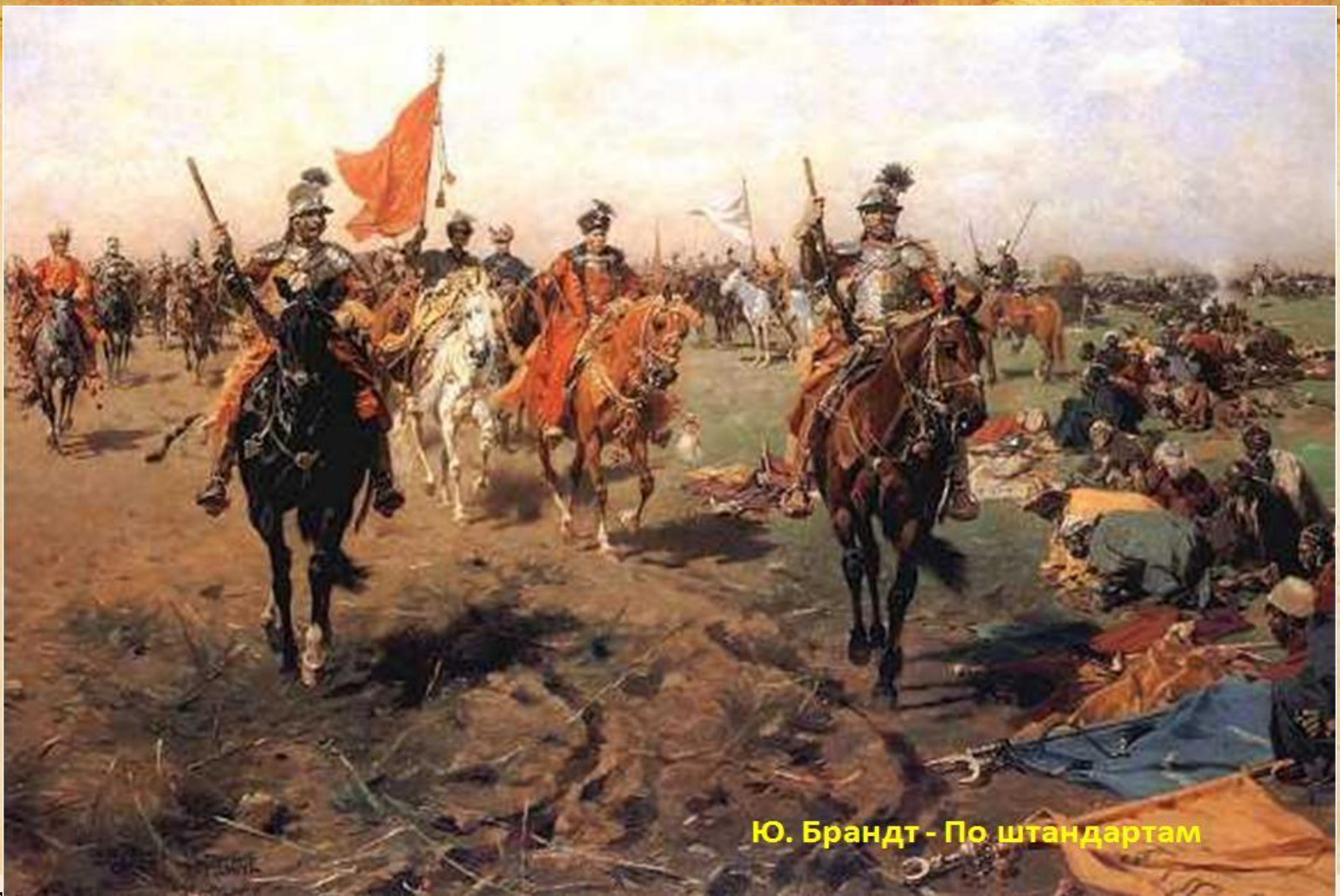
Ю. Брандт - По штандартам

Украина находилась под гнетом польских помещиков-панов. Боины против польского государства стали привычным занятием для запорожских казаков, к которым присоединялось множество крестьян, также желавших пожить вольной казацкой жизнью.