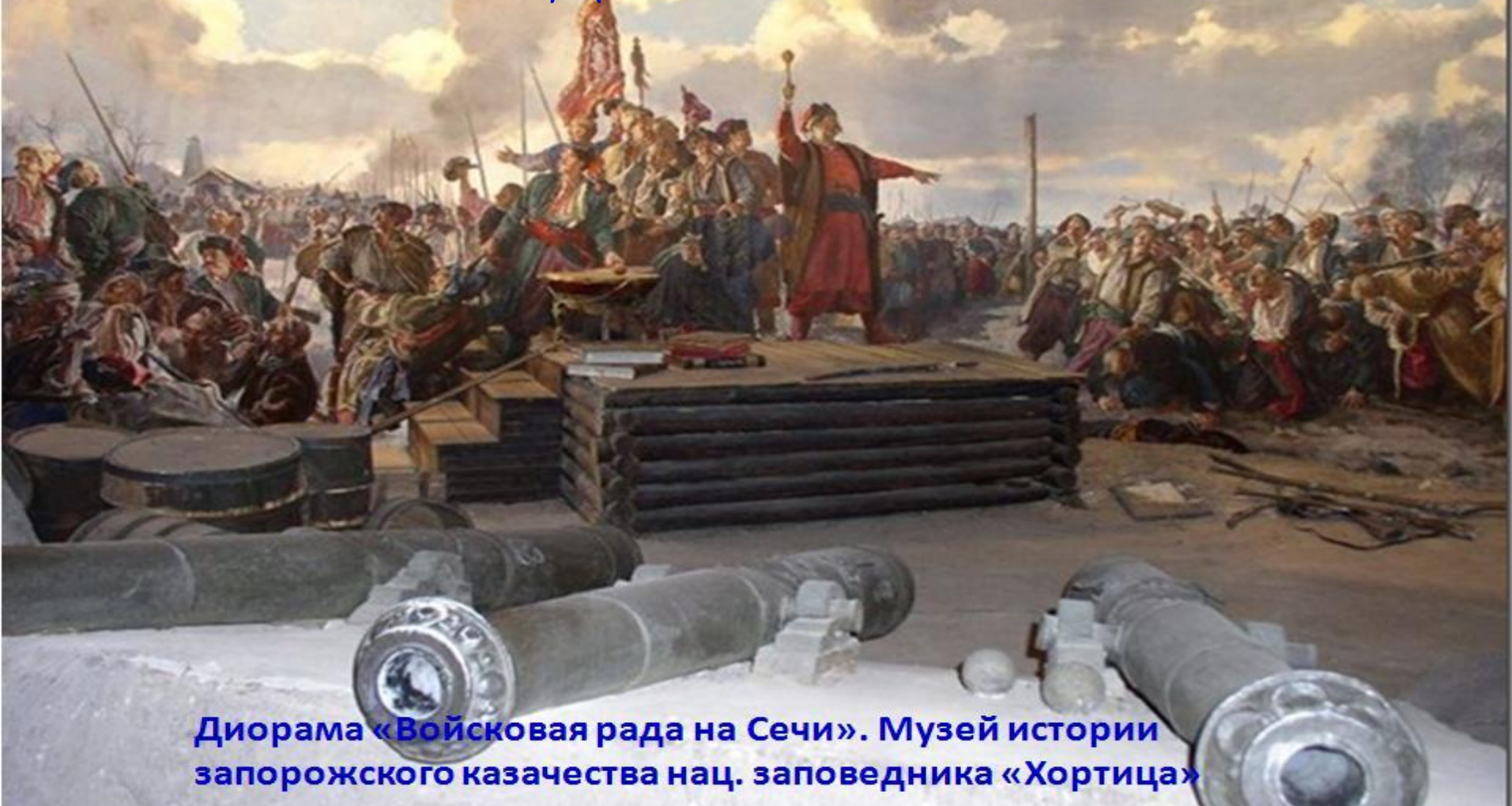
Диорама «Войсковая рада на Сечи». Музей истории запорожского казачества нац. заповедника «Хортица»

Все должностные лица коша избирались открытым голосованием на общей раде (совете) с участием всех казаков и из их числа сроком на один год. Рада запорожских казаков представляла собой высший административный, законодательный и судебный орган.