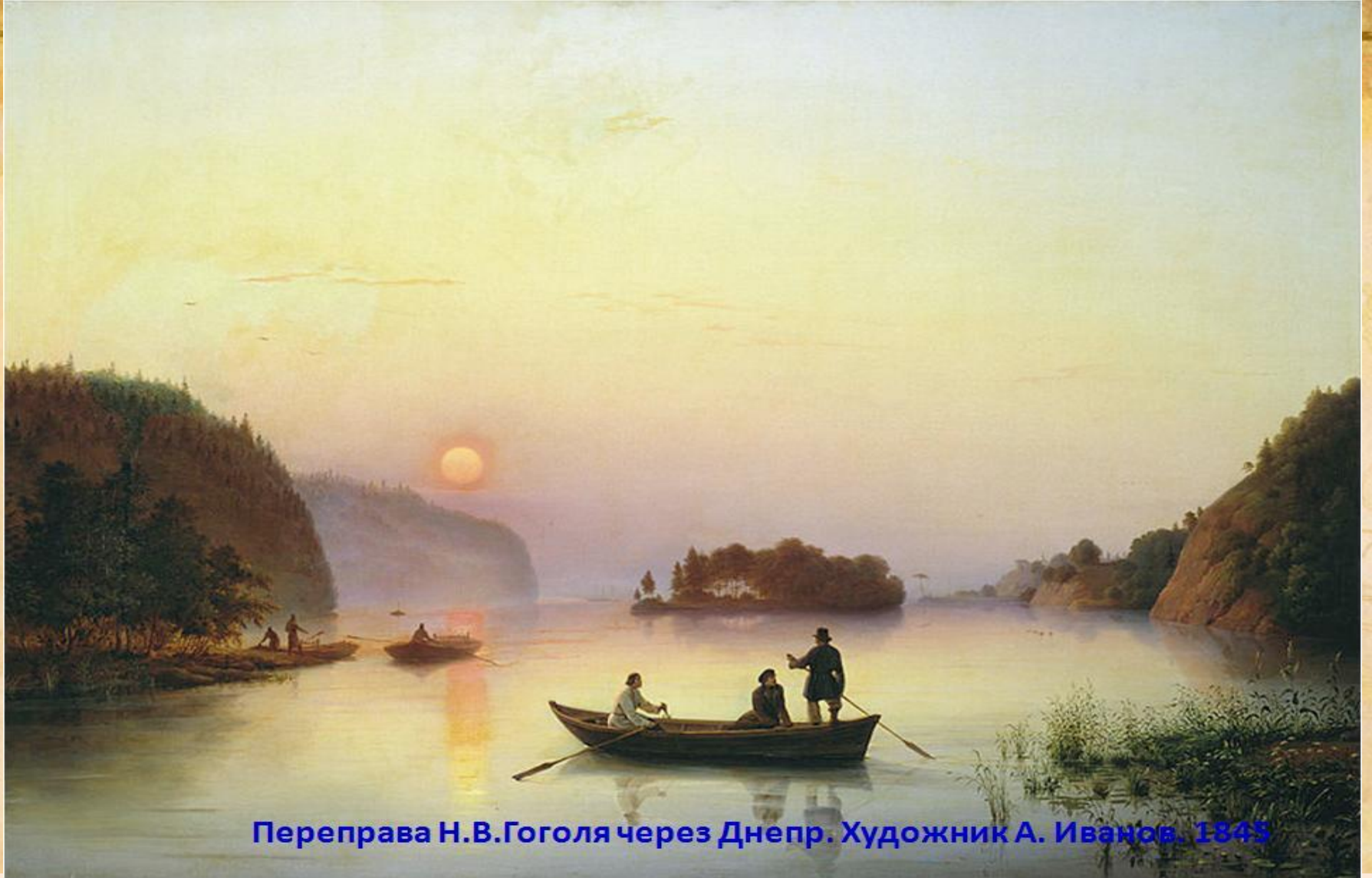
Переправа Н.В.Гоголя через Днепр. Художник А. Иванов. 1845

Основную часть казачества составляли беглые крестьяне, искавшие в незаселенных «диких полях» и на днепровских порогах спасения от польских и украинских магнатов. На островах Днепра они построили небольшое укрепление и назвали его Запорожская Сечь, а себя – запорожскими казаками.