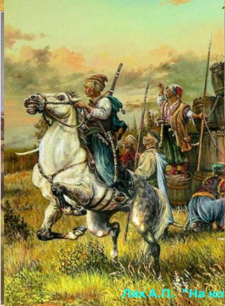
Лях А.П. "На ко"