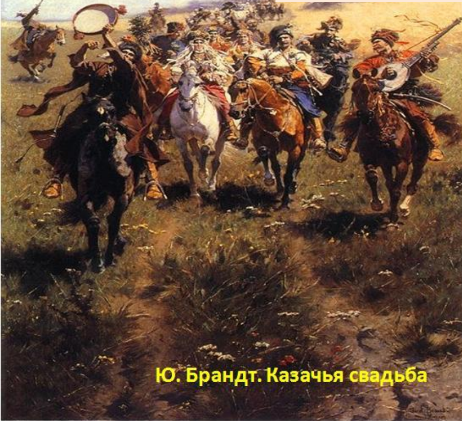
Ю. Брандт. Казачья свадьба

Промежутки козаки почитали скучным: занимались изучением какой-нибудь дисциплины, кроме разве стрельбы в цель да изредка конной скачки и гоньбы за зверем в степях и лугах; все прочее время отдавалось гульбе - признаку широкого размета душевной воли.