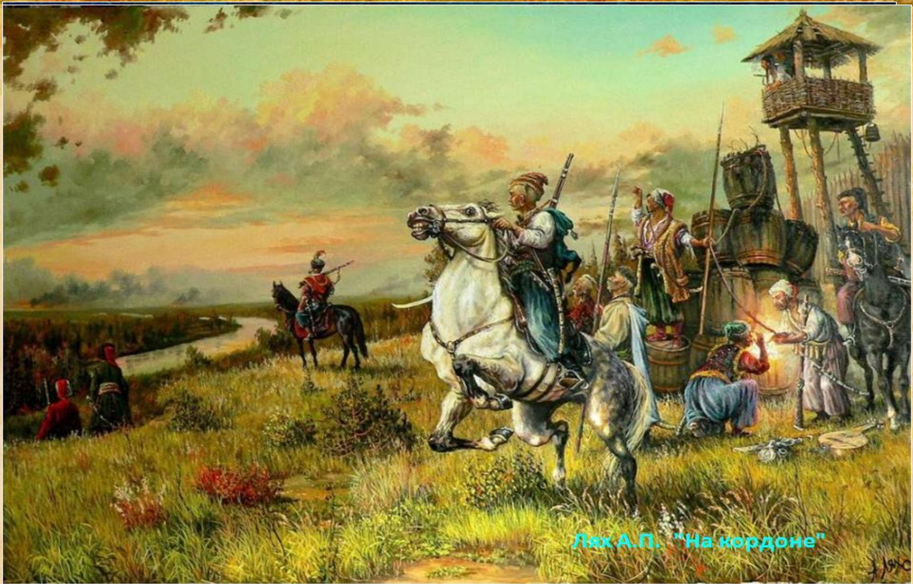
Лях А.П. "На кордоне"