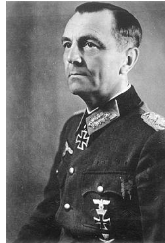
Фридрих Вильгельм Эрнст Паулюс

Положение осложнялось тем, что в городе на этот момент размещалась всего одна 64 армия, которой командовал В.И.Чуйков. именно на его бойцов и легла вся тяжесть первых оборонительных боев. Позже были подтянуты еще две армии и несколько сотен танков, но ситуация все еще была критической. Наиболее тяжелыми были бои за контроль над высотой 102 (мы знаем ее как Мамаев Курган), за Тракторный завод, который продолжал выпускать танки даже тогда, когда в его цехах шли бои.