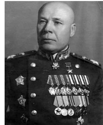
Семён Константинович Тимошенко