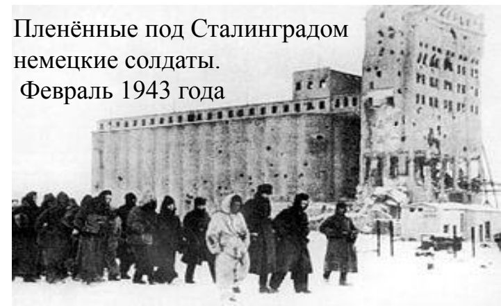
Пленённые под Сталинградом немецкие солдаты. Февраль 1943 года