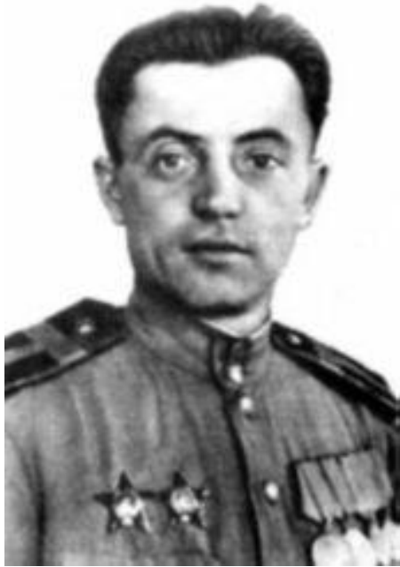
Яков Федорович Павлов

Дом Павлова после окончания Сталинградской битвы. В заднем плане — Мельница Гергарта