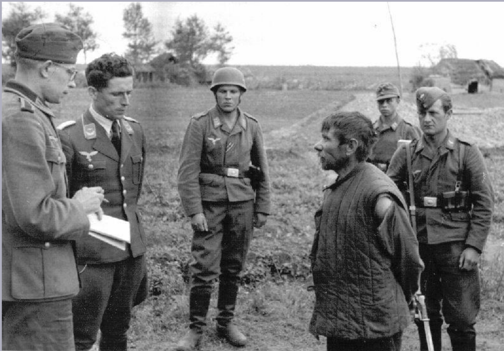
▶ Свой среди чужих