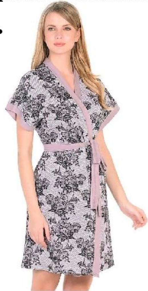
Бытовой (домашний) халат.