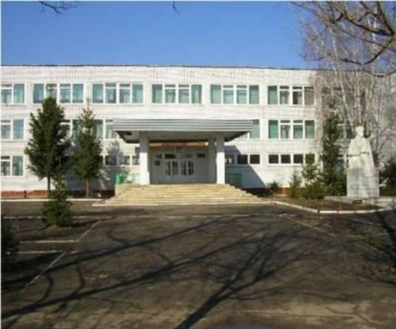
Памятник И.В. Панфилову в г. Петровске около МОУ СОШ №3 имени И.В. Панфилова