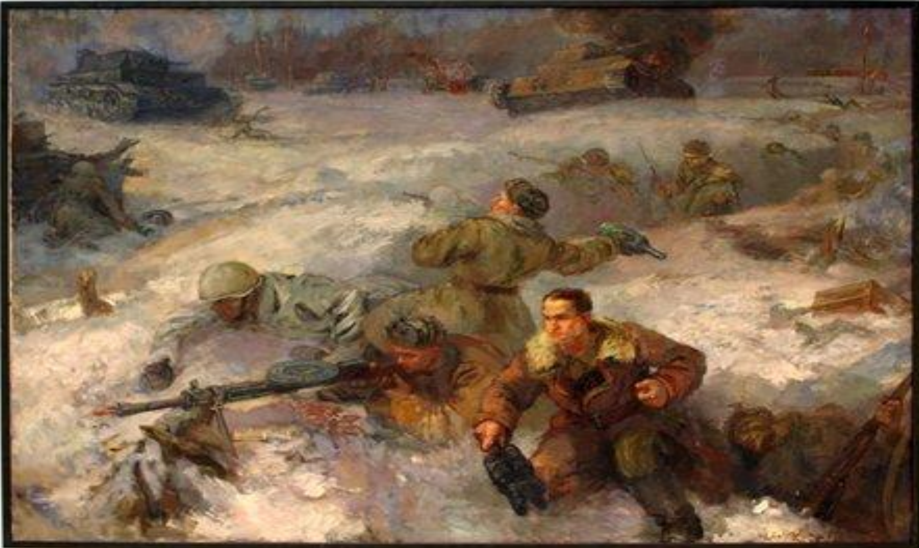
Здесь 16 ноября 1941 года группа истребителей танков 1075-го стрелкового полка 316-й стрелковой дивизии генерала И.В.Панфилова совершила свой бессмертный подвиг. 28 героев-панфиловцев в рядах, которых сражались представители многих национальностей, приняли на себя удар 50 вражеских танков.