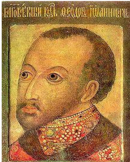
Фёдор Иоаннович, парсуна