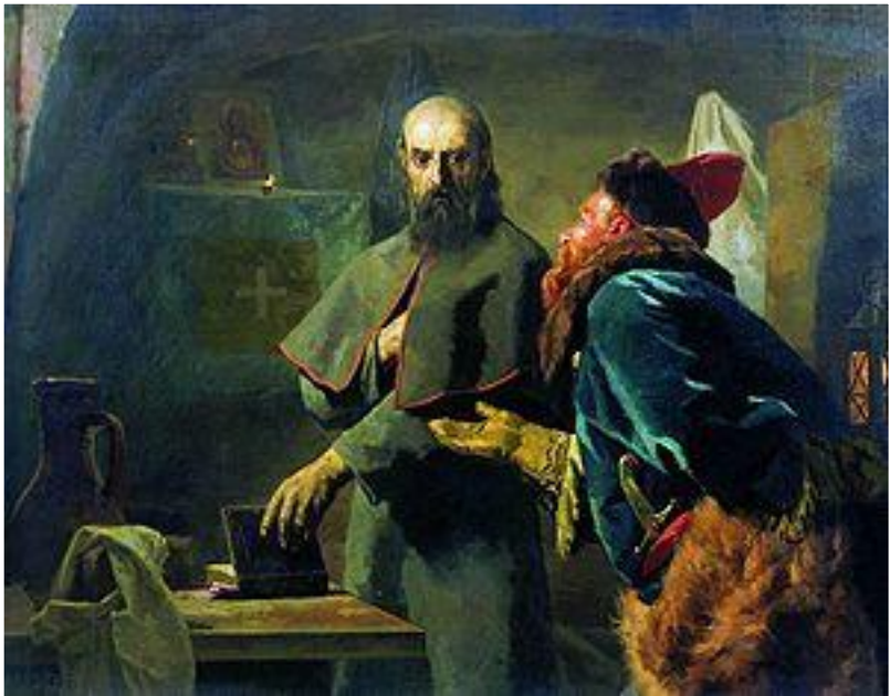
Н. В. Неврев. Малюта Скуратов и митрополит Филипп , 1898 г.