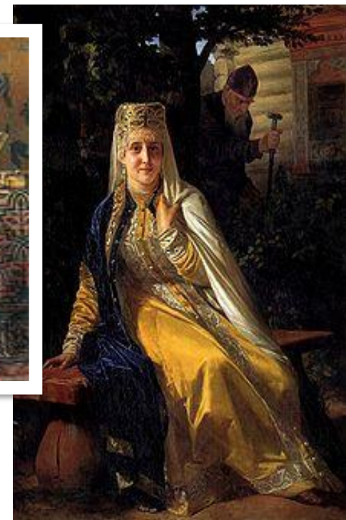
Н. Неврев. «Василиса Мелентьевна», 1886 г.