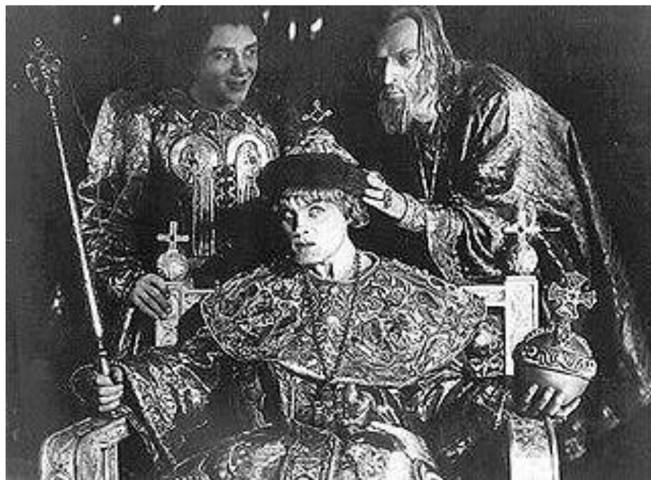
Иван Грозный сажает Владимира Старицкого на царский престол. (кадр из фильма С. Эйзенштейна «Иван Грозный», 1944 г.)