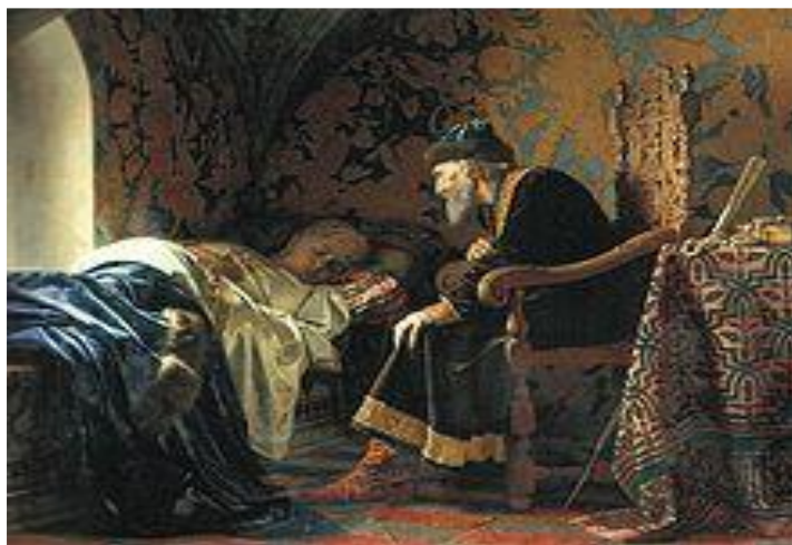
Г.С. Седов. Царь Иван Грозный любуется на Василису Мелентьевну, 1875 г.