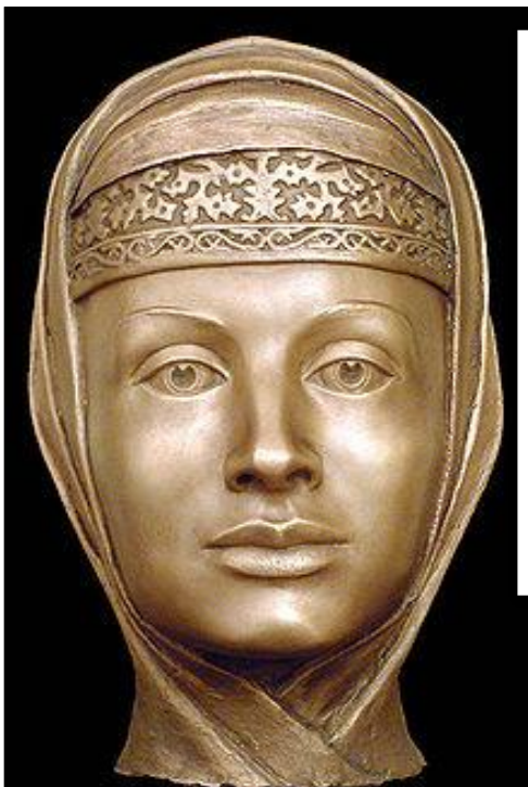
Марфа Собакина. Скульптурная реконструкция по черепу