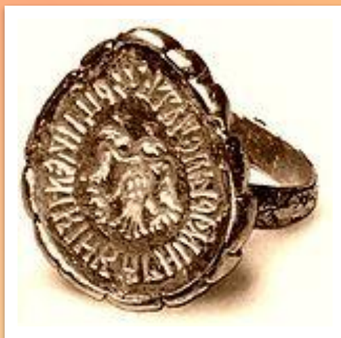
Перстень-печать царицы Марии Темрюковны