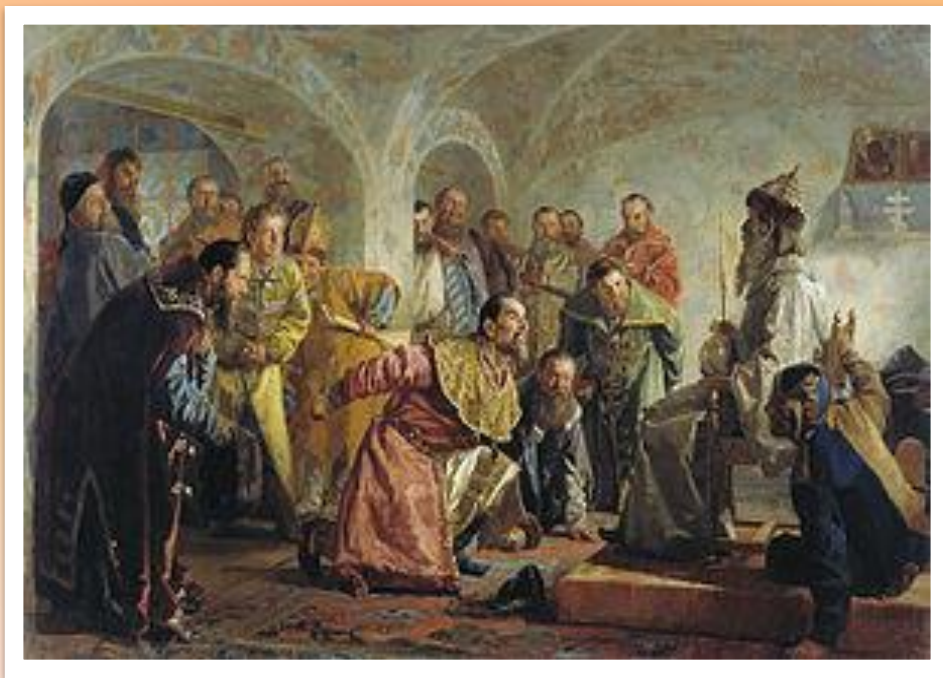
Н. В. Неврев. Опричники.

Изображено убийство боярина И. П. Фёдорова в 1568 г., которого Грозный, обвинив в желании захватить власть, заставил надеть царские одежды и сесть на трон, после чего зарезал.