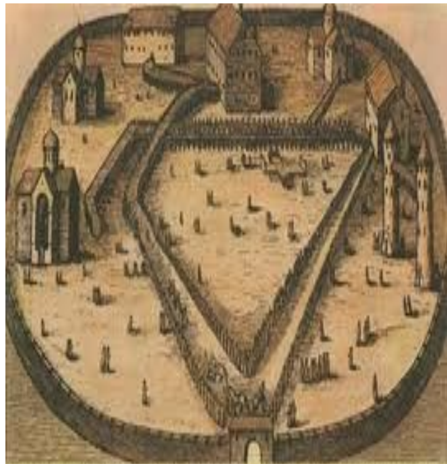
Опричная резиденция - Александровская слобода (со старинной гравюры)