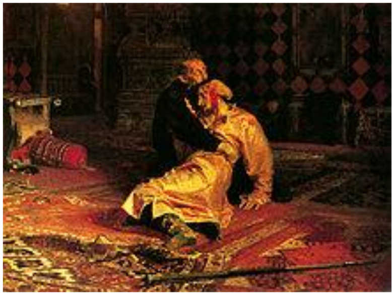
И. Е. Репин. Иван Грозный и сын его Иван 16 ноября 1581 года, 1885 г.