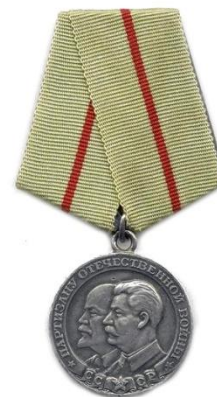
Медаль «Партизану Отечественной войны»