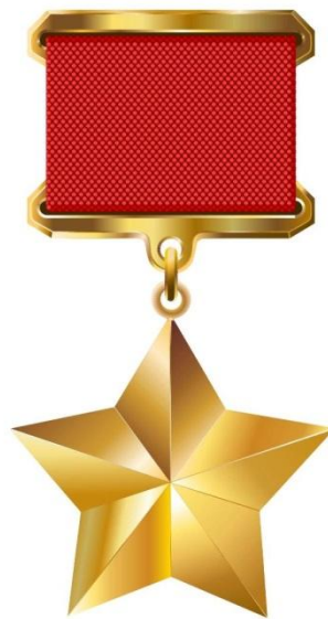
Звезда Героя Советского Союза