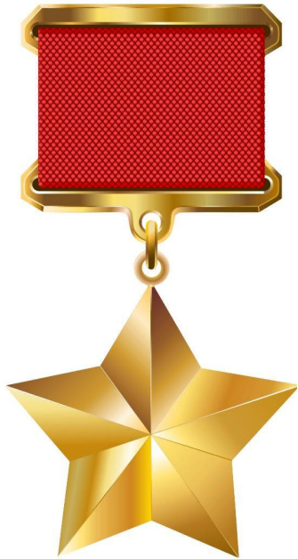
Звезда Героя Советского Союза