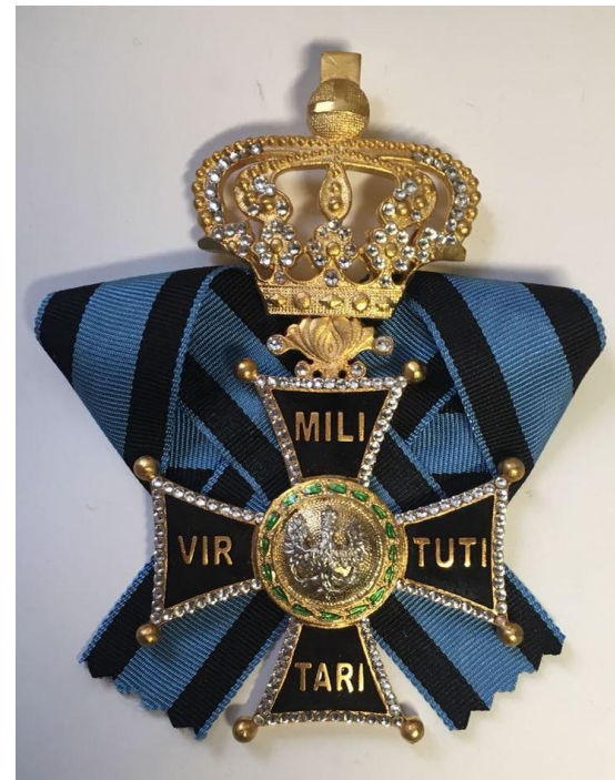
Орден «Виртути Милитари»