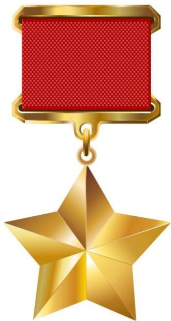
Золотая звезда (2 раза)