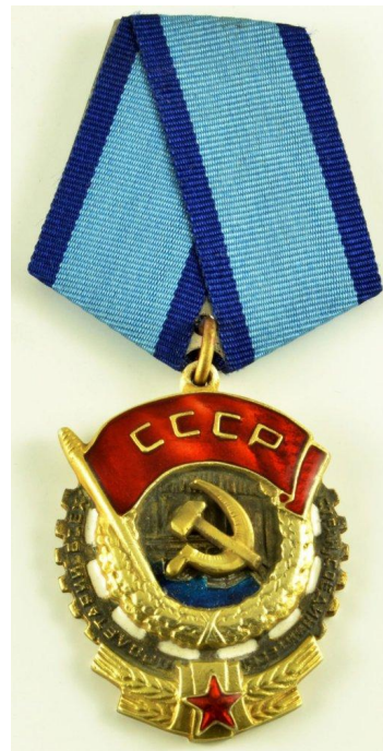
Орден Трудового Красного Знамени