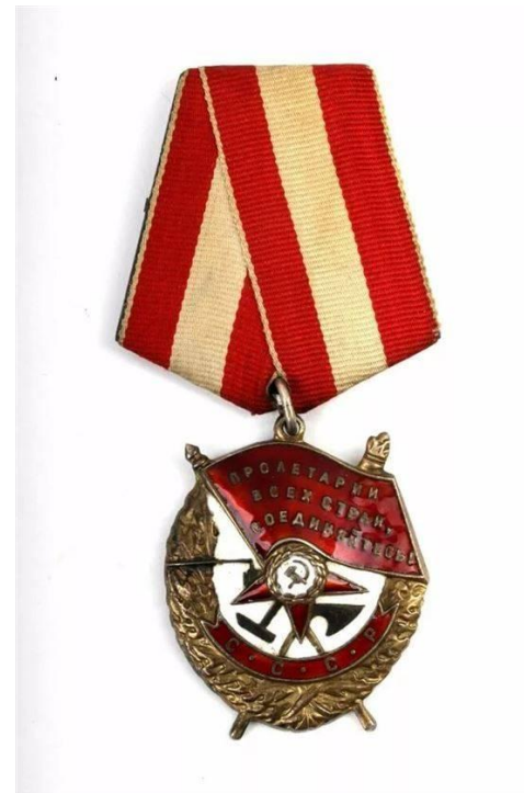
Звезда Героя Советского Союза Медаль «За оборону Кавказа» Орден Красного Знамени