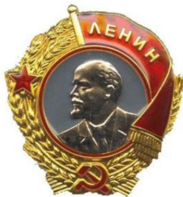
Орден Ленина (2 раза)