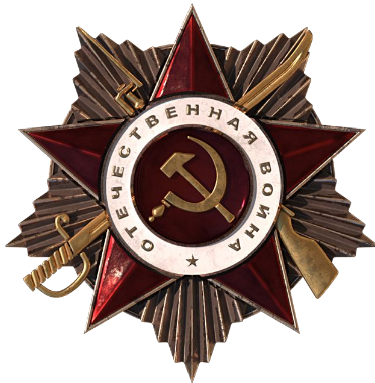
Орден Отечественной войны