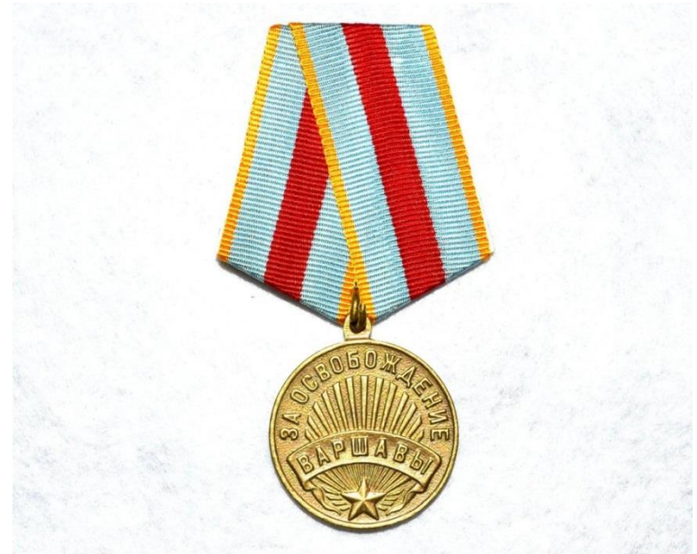
Орден Красной Звезды Орден Красного Знамени Медаль «За освобождение Варшавы»