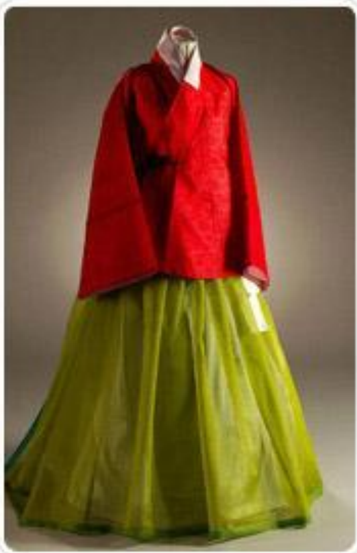
женский ханбок 16-го века