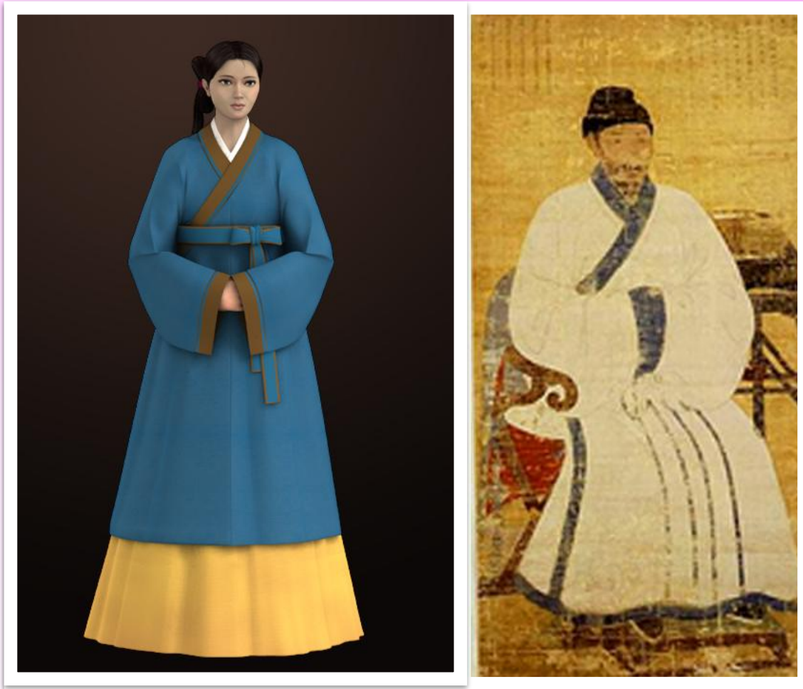
고려 시대 한복