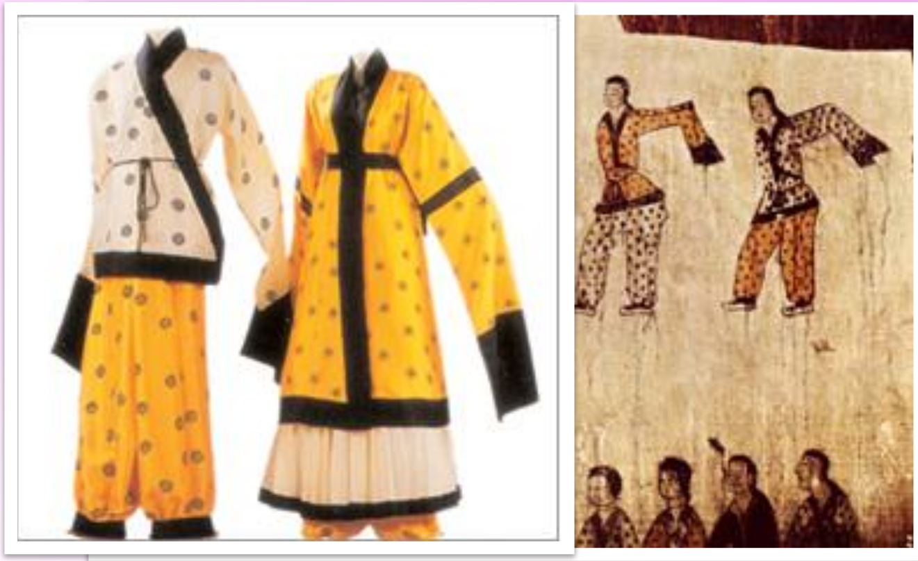
고구려 시대 한복