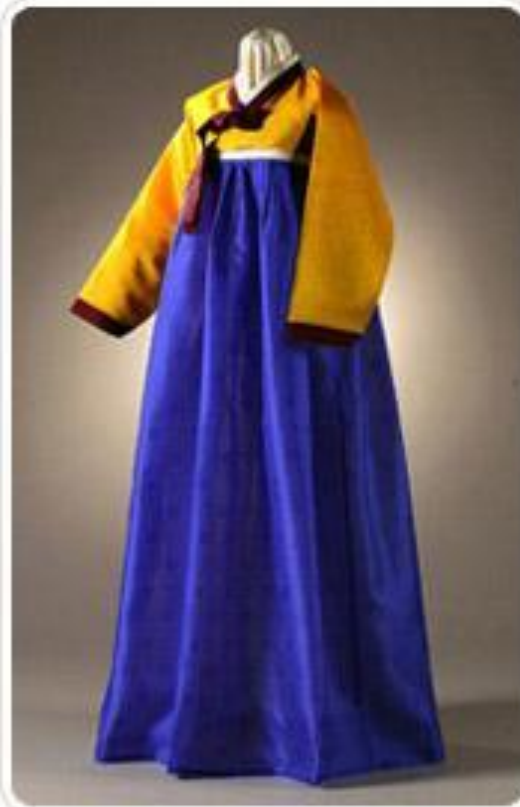
женский ханбок 18-го века