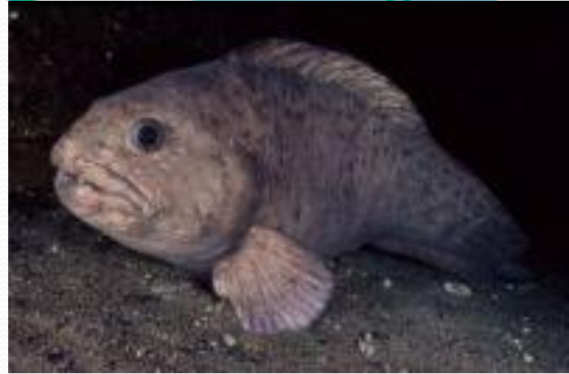
Северная зубатка крупная морская рыба