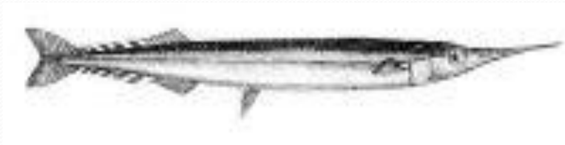
Рыба-стрела (Обыкновенный сарган) стайная морская рыба