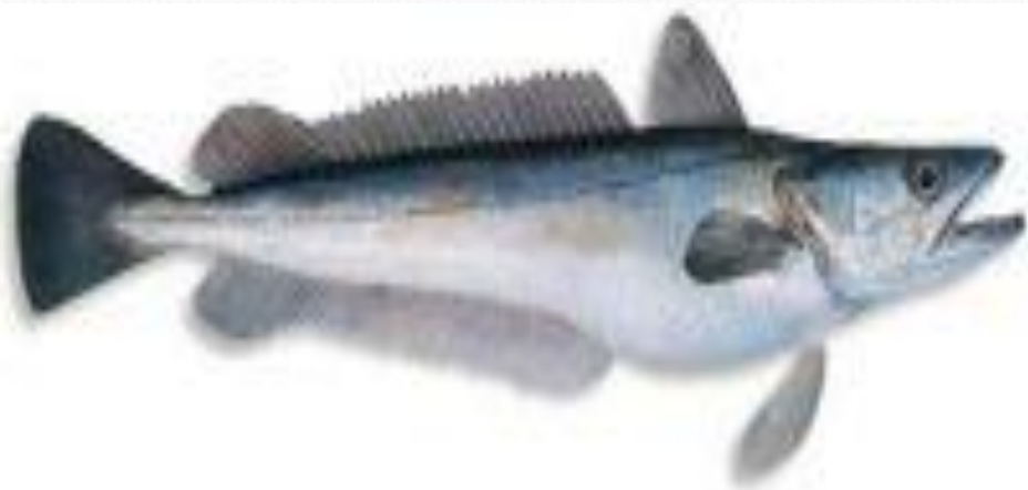
Европейский хек (Европейская мерлуза)- эндемик Атлантического океана