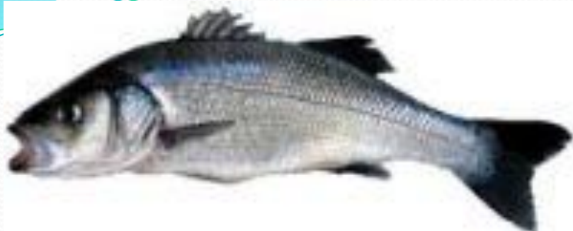
Морской волк рыба семейства Мороновых