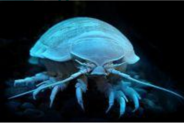
Гигантские изоподы крупные равноногие раки.