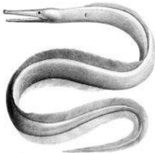
Морской угорь, обитающий только в прибрежных водах Атлантического океана и в западной части Средиземного моря. Имеет прозвище «колдун-черный плавник».