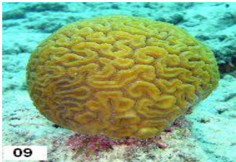
Коралл - мозговик