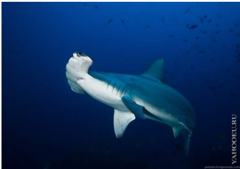
Рыба - Молот