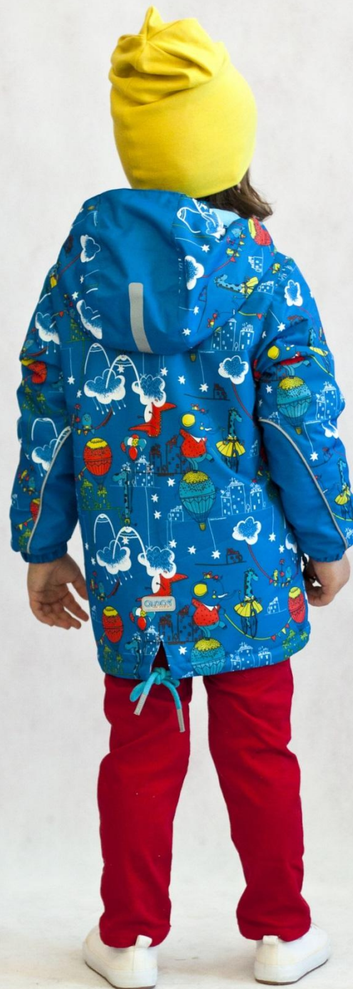
Куртка утепленная ЯНИС Цвет «голубой», размеры 86-104