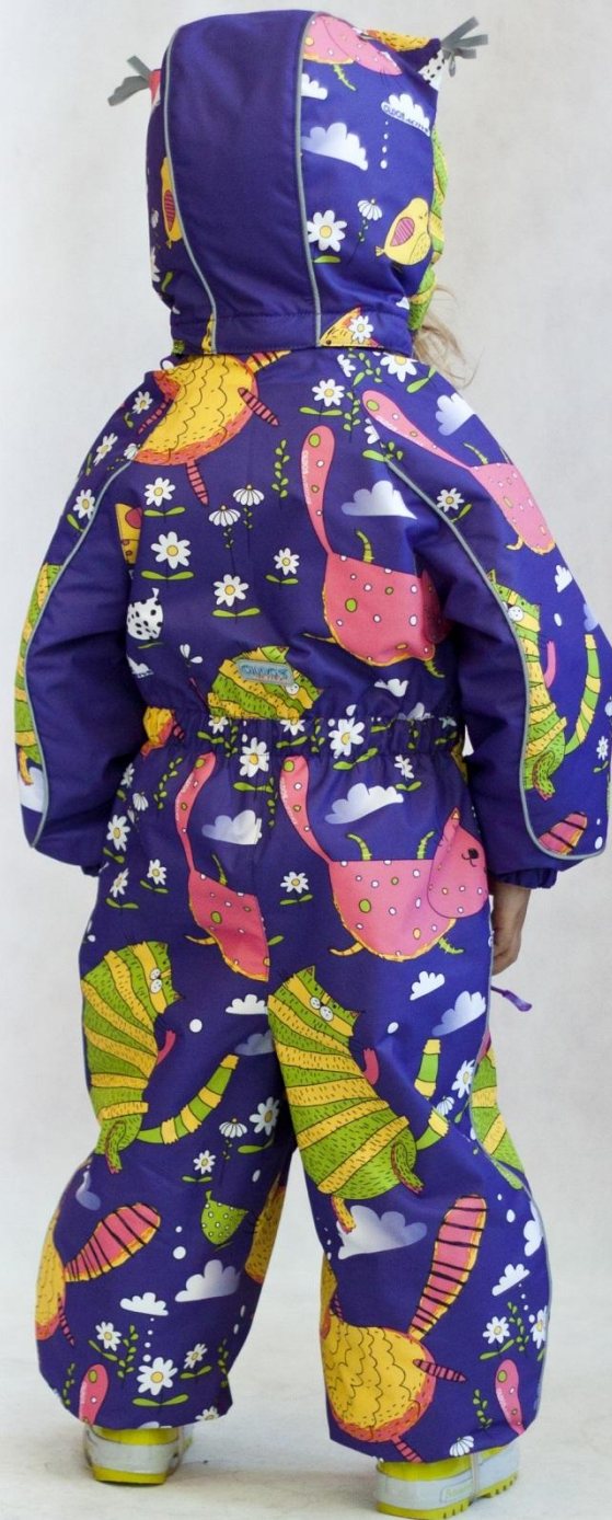
Комбинезон ШЕРИЛ (с утеплителем) Цвет «фиолетовый», размеры 74-98