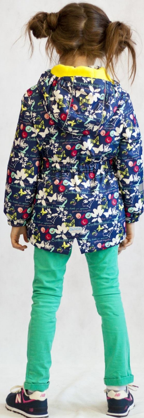
Куртка утепленная МИЛАНА Цвет «синий» Размеры 86-116, 122-140