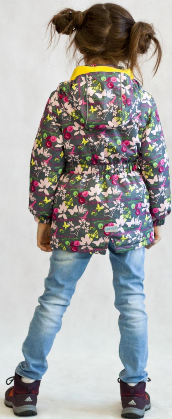
Куртка утепленная МИЛАНА Цвет «серый» Размеры 86-116, 122-140