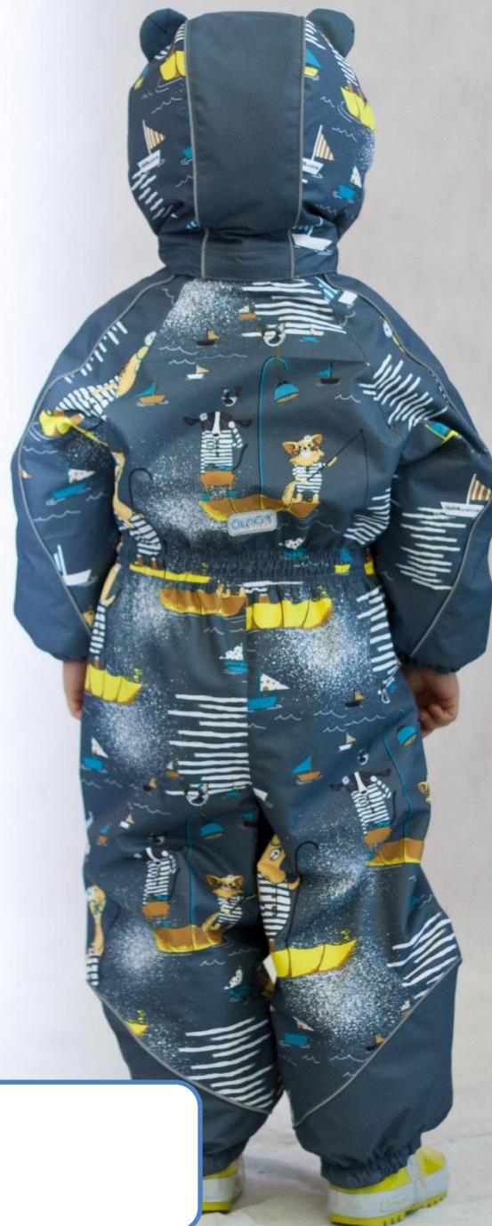
Комбинезон МОРСКОЕ ПУТЕШЕСТВИЕ (с утеплителем) Цвет «серый», размеры 74-98