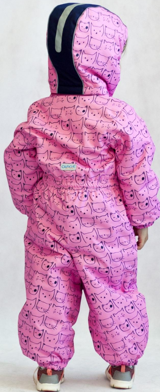
Комбинезон КИСА (с утеплителем) Цвет «розовый» , размеры 74-98