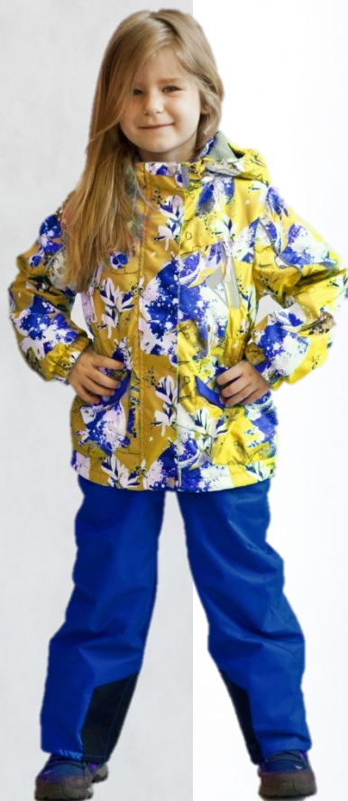
Костюм САБИНА с утепленной курткой Цвет «банановый_синий» Размеры 86-116, 122-140