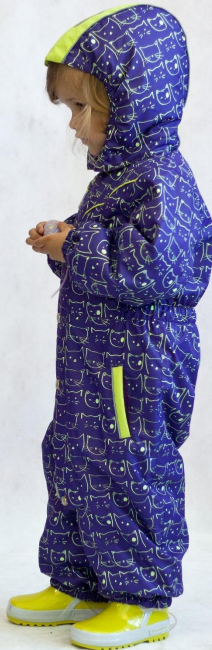
Комбинезон КИСА (с утеплителем) Цвет «фиолетовый» , размеры 74-98