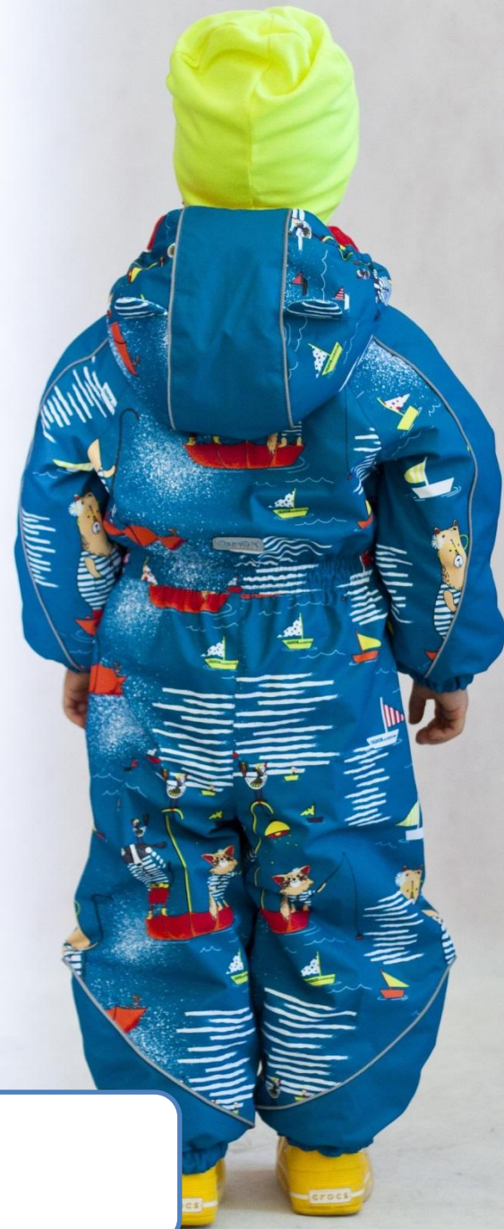
Комбинезон МОРСКОЕ ПУТЕШЕСТВИЕ (с утеплителем) Цвет «синий», размеры 74-98