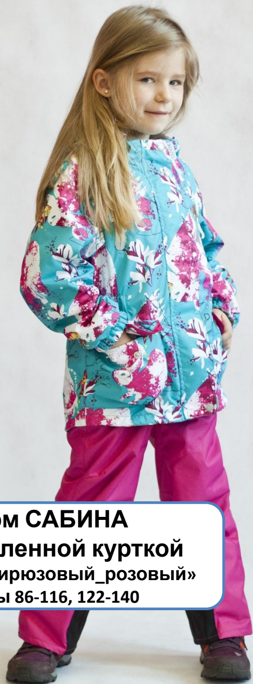
Костюм САБИНА с утепленной курткой Цвет «бирюзовый_розовый» Размеры 86-116, 122-140