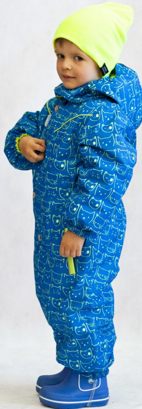
Комбинезон КИСА (с утеплителем) Цвет «голубой», размеры 74-98