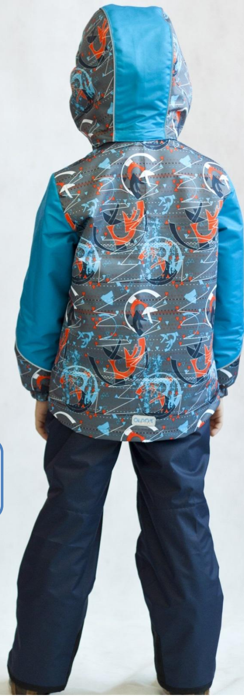
Костюм МАРСЕН с утепленной курткой Цвет «синий» Размеры 86-116, 122-140