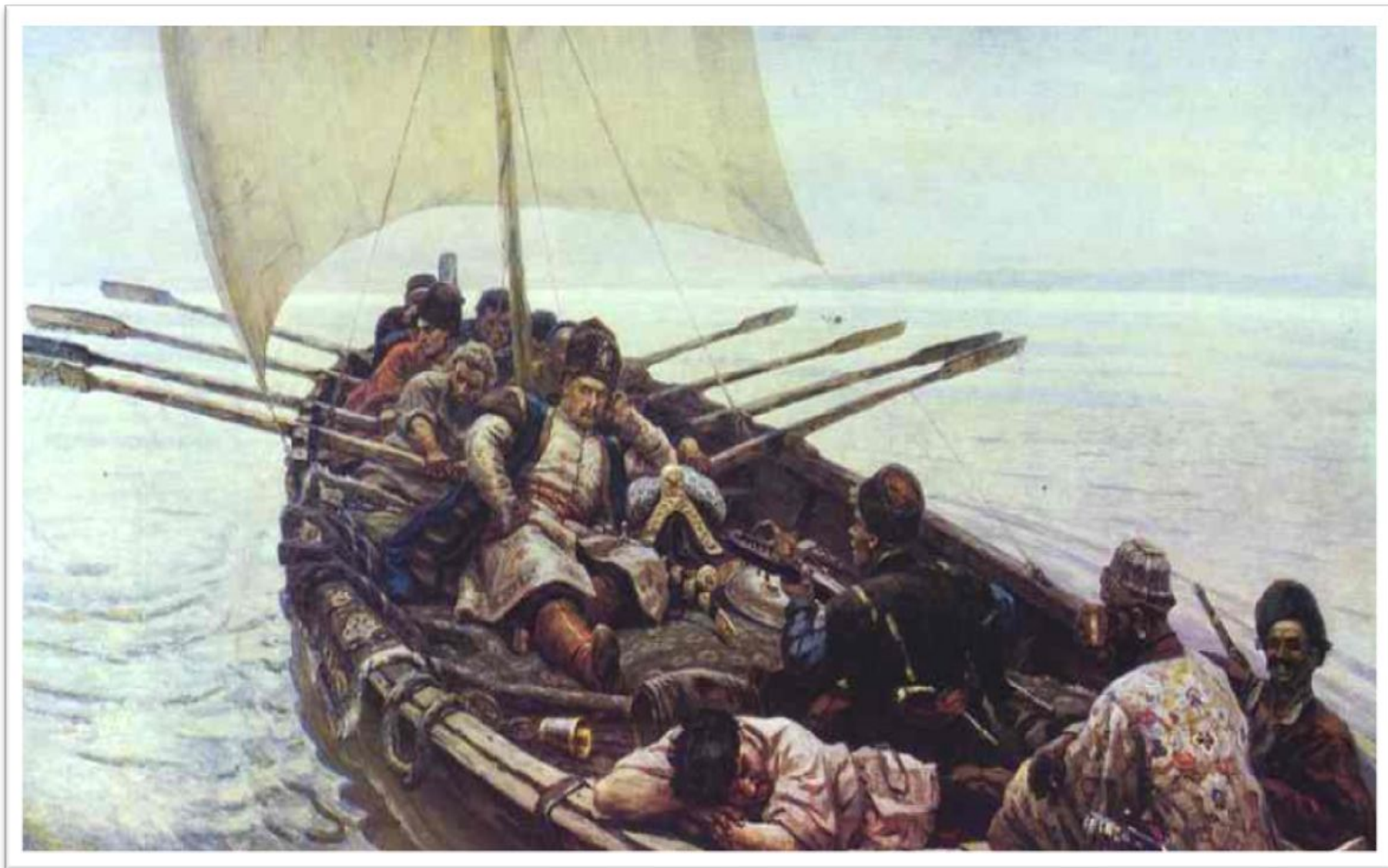
В.И.Суриков «Степан Разин»