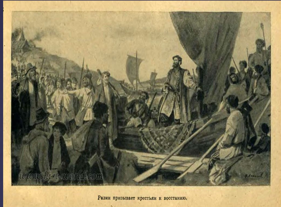
Разин призывает крестьян к восстанию.