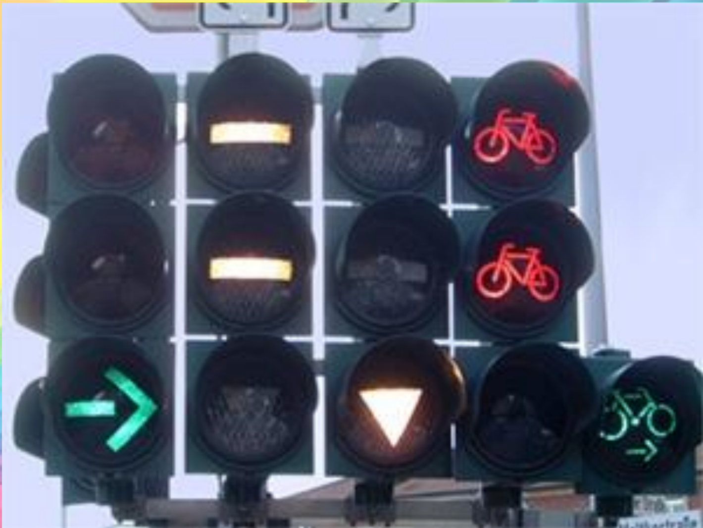
Светофор для велосипедов в Вене