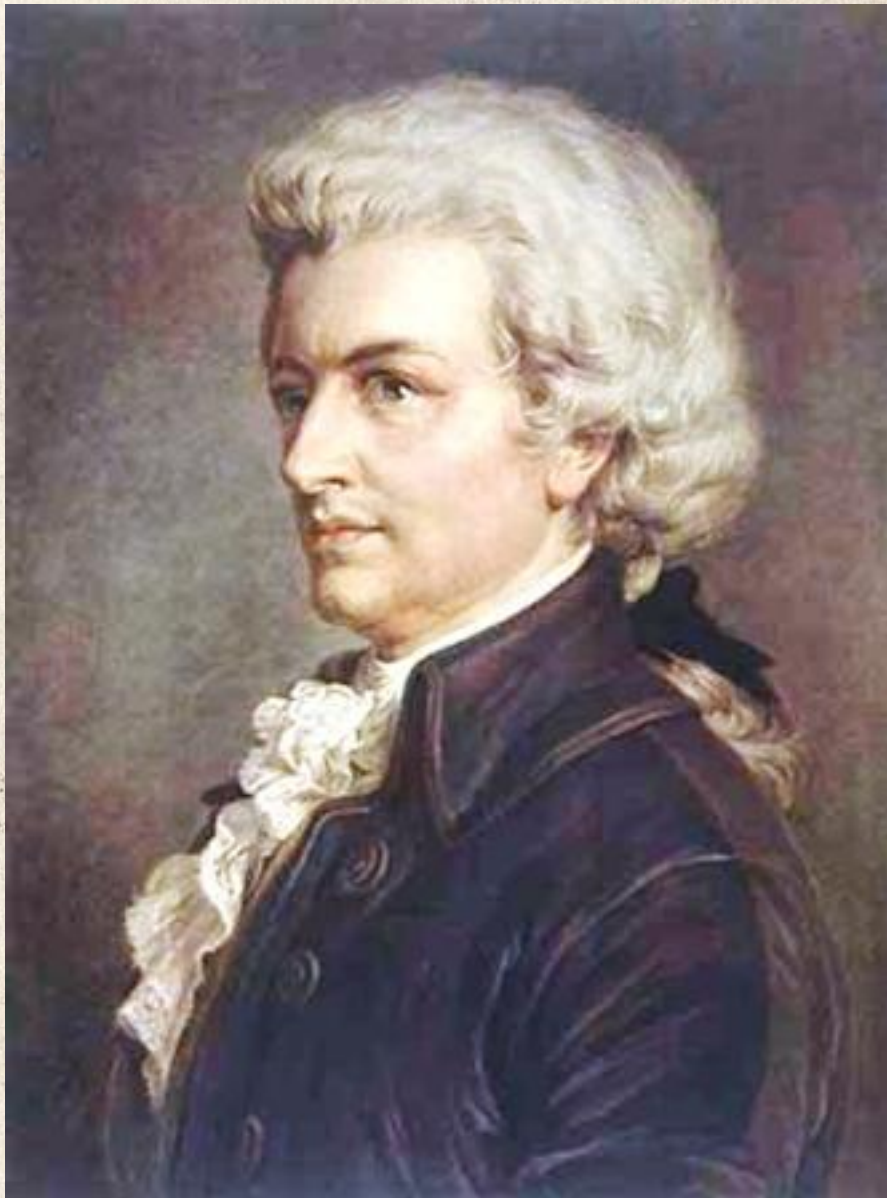
Моцарт Вольфганг Амадей (1756— 1791), австрийский композитор.