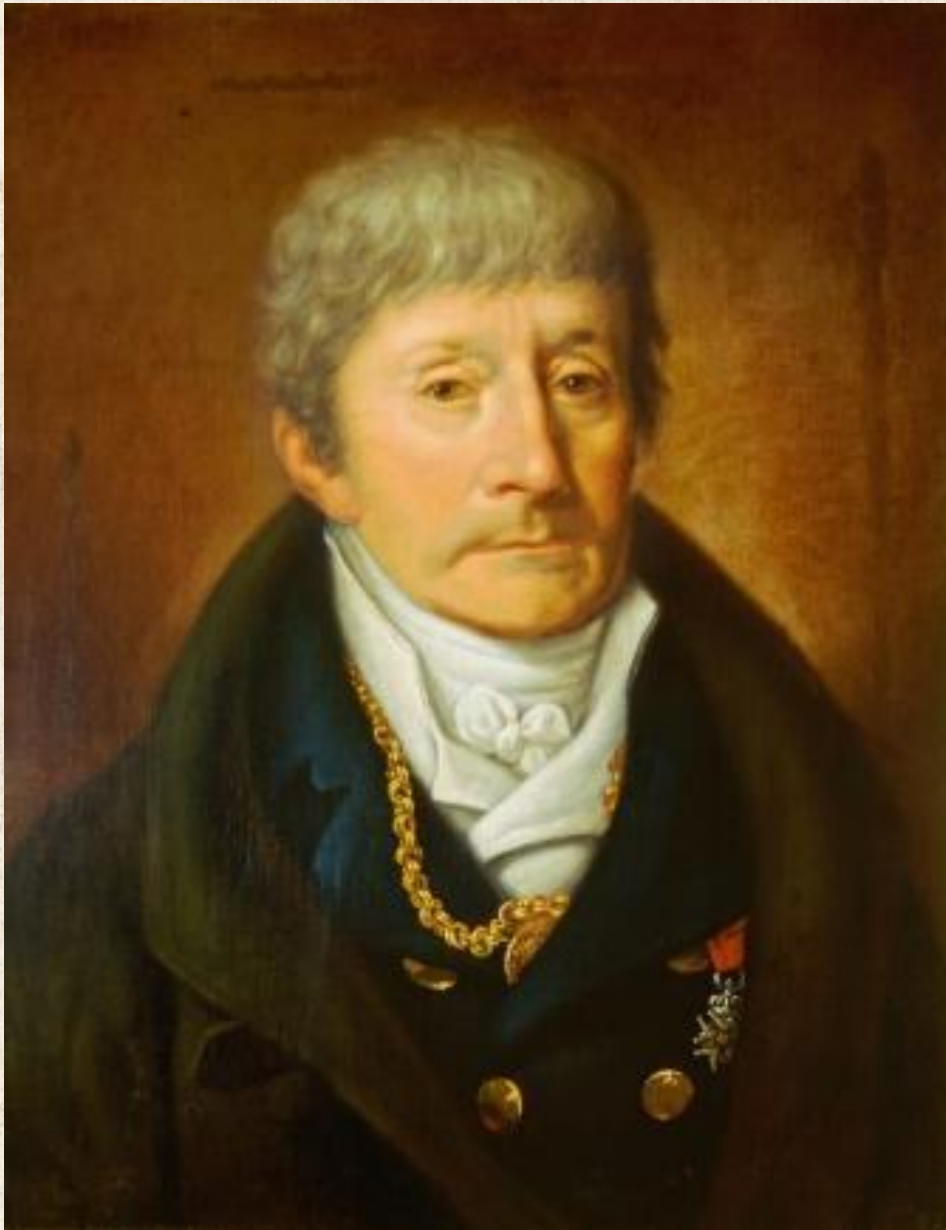
Сальери Антонио (1750—1825), итальянский композитор, дирижёр и педагог