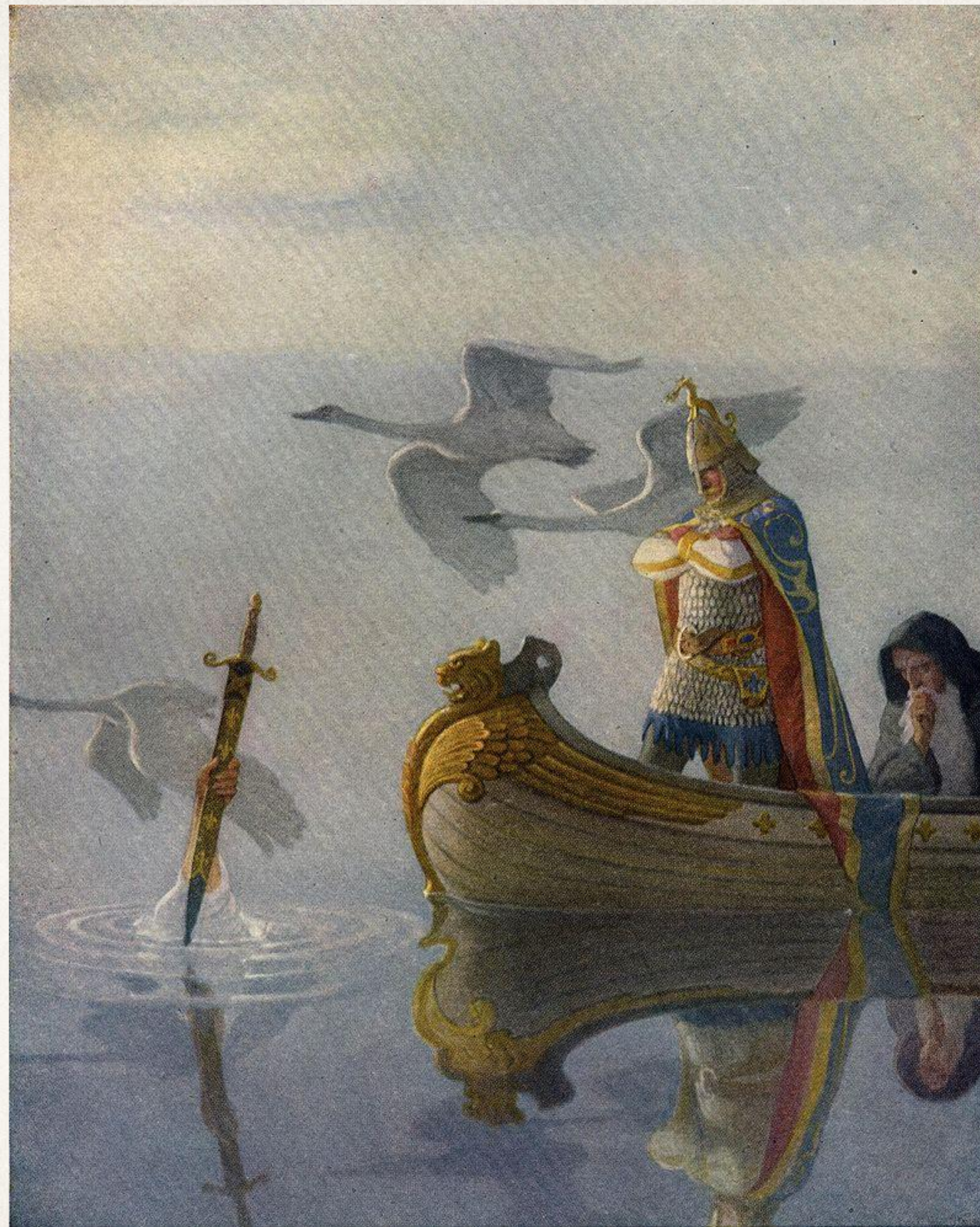
Владычица Озера вручает Артуру меч

У Артура был еще один чудесный меч, который подарила ему Дева Озера, - Экскалибур.