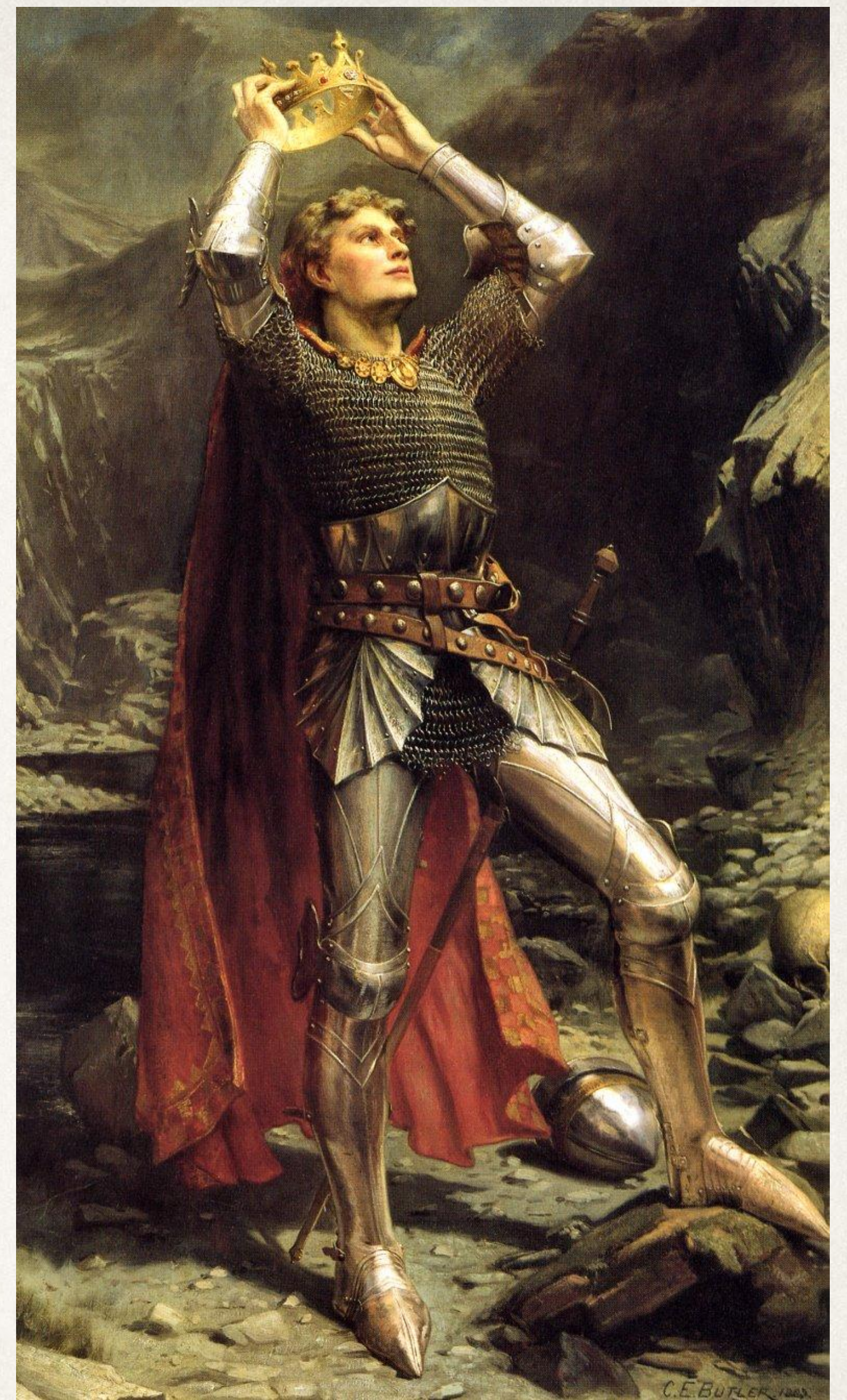
«Король Артур», Чарльз Эрнест Батлер

Артуру удалось взойти на трон, лишь добыв волшебный меч при помощи Мерлина.