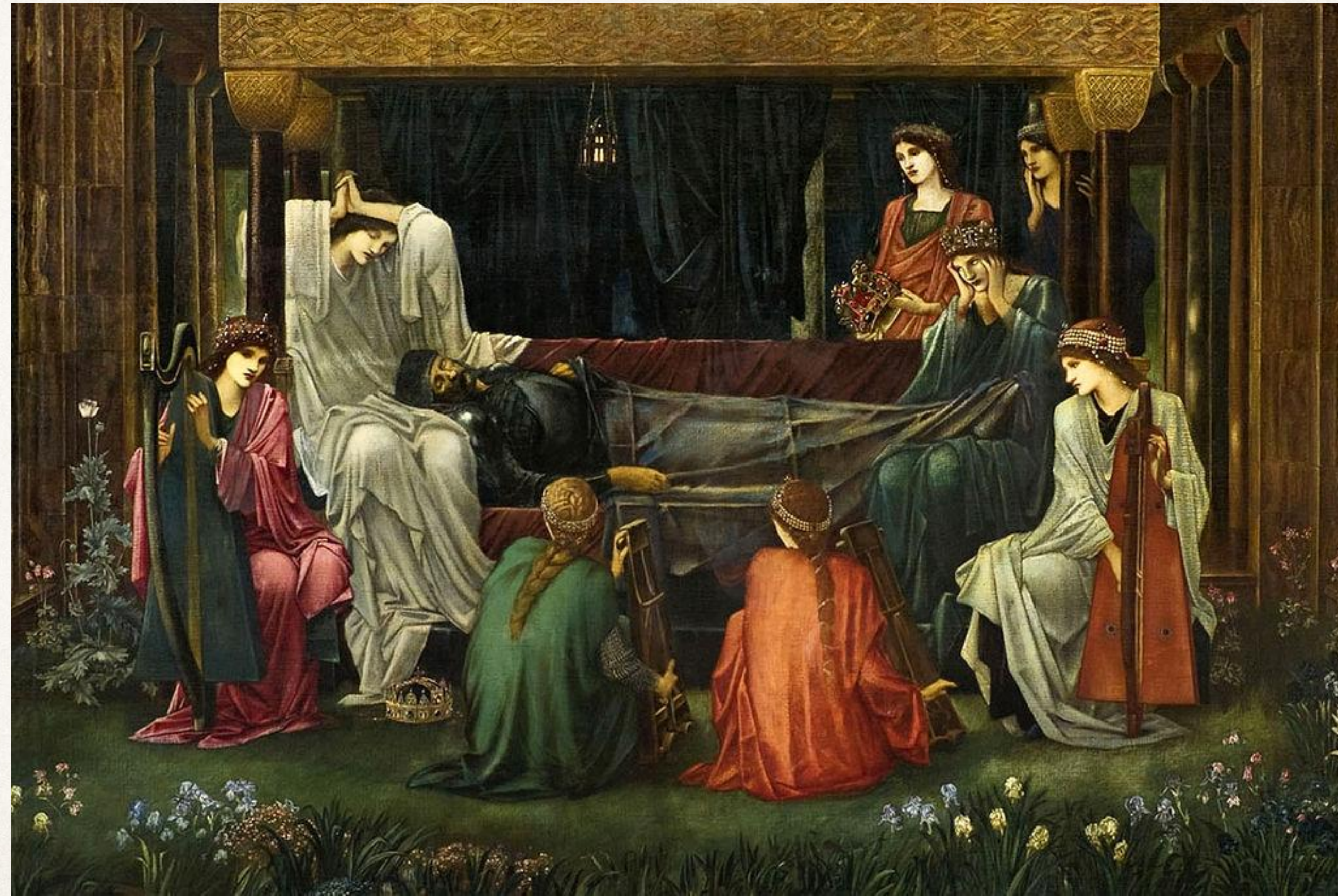
«Последний сон короля Артура», Э. К. Бёрн-Джонс

По преданию, фея Моргана увезла раненного короля на волшебный остров Авалон, где он до сих пор лежит, погруженный в волшебный сон.