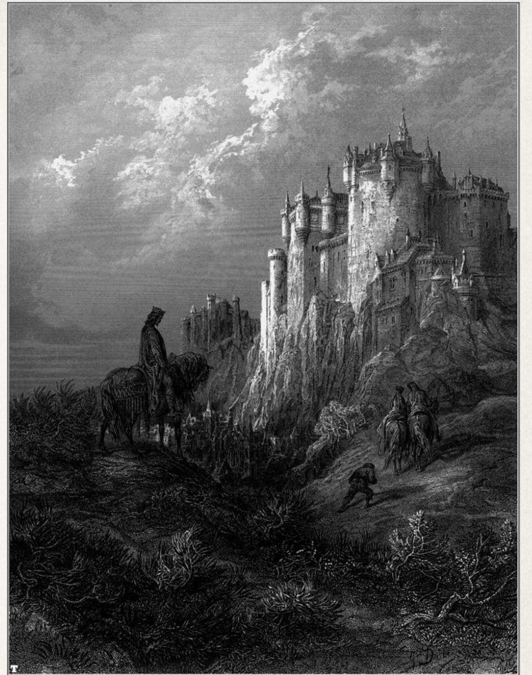
Камелот на гравюре Гюстава Доре, 1868

Артур строит себе дворец Камелот, в котором находится знаменитый Круглый стол, за которым и восседают славные рыцари короля Артура.