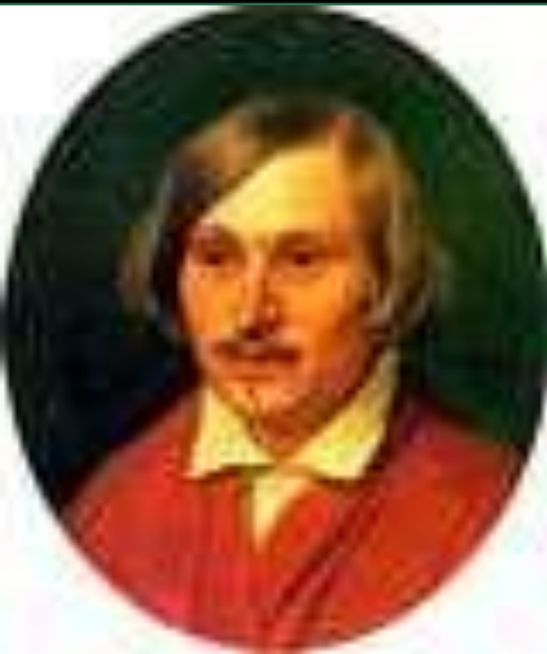
Портрет А.А. Иванова. 1841 г.

Гоголь – поэт, поэт жизни действительной.