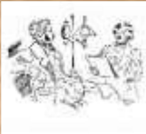
Гоголь и Пушкин

Вскоре после постановки "Ревизора", затравленный реакционной печатью и "светской чернью". Гоголь уехал в Германию, конец лета провёл в Швейцарии, затем поселился в Париже, продолжая работу над "Мертвыми душами", начатую в России. Известие о гибели Пушкина было для него страшным ударом. В марте 1837 поселился в Риме. Во время приезда в Россию в 1839 - 40 читал друзьям главы из первого тома "Мертвых душ", который был завершен в Риме в 1840 - 41.