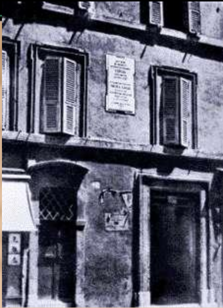
Дом Гоголя в Риме

1842-1845 гг. - период напряженной и трудной работы над 2-м томом "Мертвых душ".