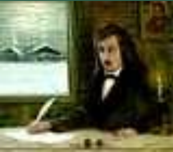
Художник И. Соколов. 20-го века