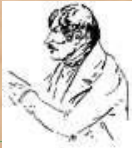
Гоголь читает «Мёртвые души» у Нащёкиных. 1838 г.

Вскоре после постановки "Ревизора", затравленный реакционной печатью и "светской чернью". Гоголь уехал в Германию, конец лета провёл в Швейцарии, затем поселился в Париже, продолжая работу над "Мертвыми душами", начатую в России. Известие о гибели Пушкина было для него страшным ударом. В марте 1837 поселился в Риме. Во время приезда в Россию в 1839 - 40 читал друзьям главы из первого тома "Мертвых душ", который был завершен в Риме в 1840 - 41.