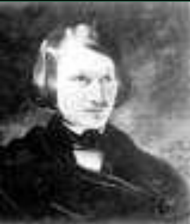
Портрет писателя работы художника Ф.А. Моллера

21 февраля 1852 года Гоголя не стало. В память о друге Аксаков заказал для себя копию с его портрета, написанного Ф.А. Моллером, которая хранится в музее. Об этом портрете еще при жизни Гоголя Аксаков писал: "Таким бывает Гоголь в счастливые минуты творчества".