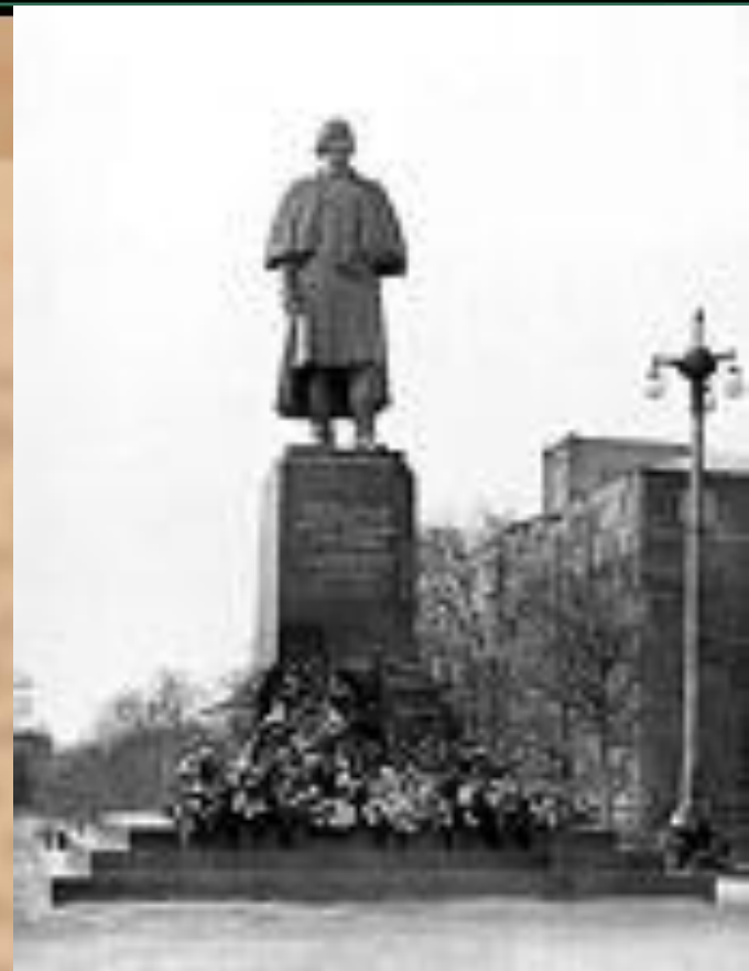
Памятник Гоголю. Томский