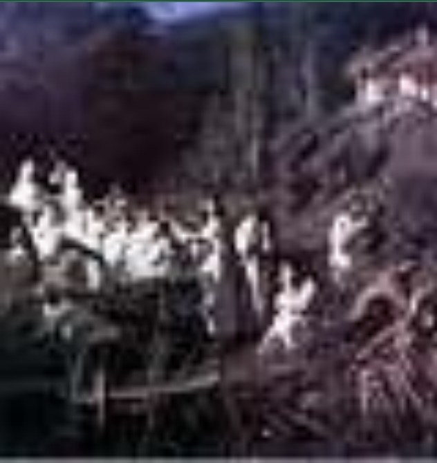
«Майская ночь, или Утопленница»

Литературную известность Гоголю принесли "Вечера на хуторе близ Диканьки" (1831 - 1832), повести "Сорочинская ярмарка", "Майская ночь" и др. В 1833 пришел к решению посвятить себя научной и педагогической работе и в 1834 был назначен адъюнкт-профессором по кафедре всеобщей истории при Санкт-Петербургском университете.