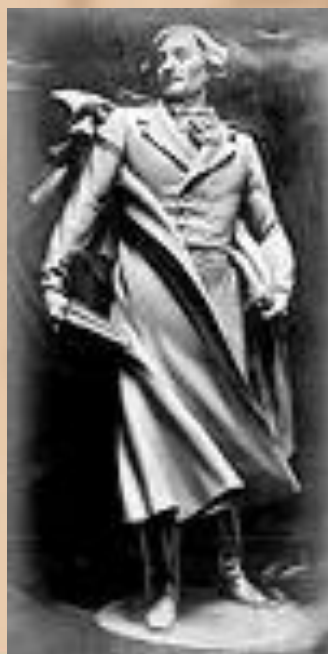
Проект Меркулова памятника Гоголю