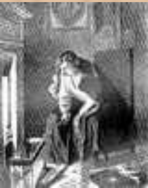
Гоголь сжигает вторую часть "Мёртвых душ"

1 января 1852 г. Гоголь сообщает Арнольди, что 2-й том "совершенно окончен". Но в последних числах месяца явственно обнаружилось признаки нового кризиса, толчком к которому послужила смерть Е. М. Хомяковой, сестры Н. М. Языкова, человека, духовно близкого Гоголю. Его терзает предчувствие близкой смерти, усугубляемое вновь усилившимися сомнениями в благотворности своего писательского поприща и в успехе осуществляемого труда. 7 февраля Гоголь исповедуется и причащается, а в ночь с 11 на 12 сжигает беловую рукопись 2-го тома (сохранилось в неполном виде лишь 5 глав, относящихся к различным черновым редакциям; опубликованы в 1855 г.).