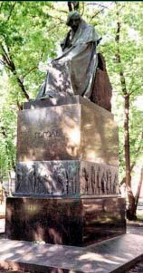
Памятник Гоголю во дворе дома Талызина на Никитском бульваре. Скульптор Н. Андреев. 1909 г.