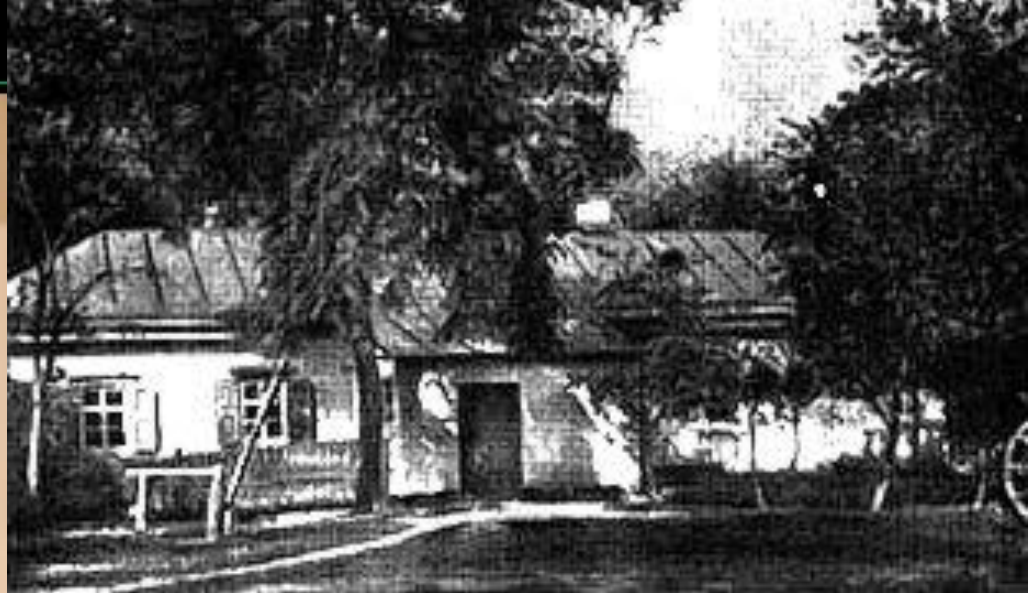
Дом доктора М.Я.Трохимовского в Сорочинцах, где родился Гоголь

Н. В. Гоголь родился 20 марта 1809 года в местечке Великие Сорочинцы Миргородского уезда Полтавской губернии в семье небогатого помещика. Назвали Николаем в честь чудотворной иконы святого Николая, хранившейся в церкви села Диканька.