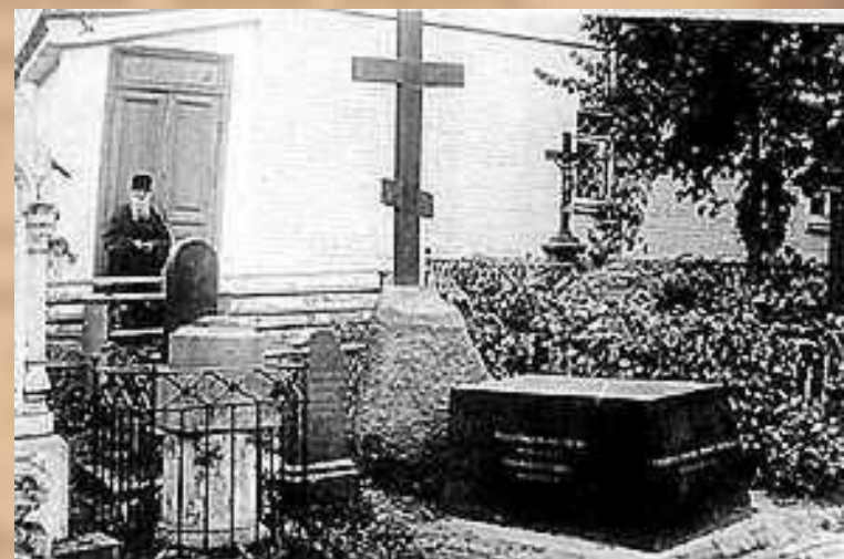
Бывшая могила Н.В. Гоголя в Свято-Даниловом монастыре в Москве