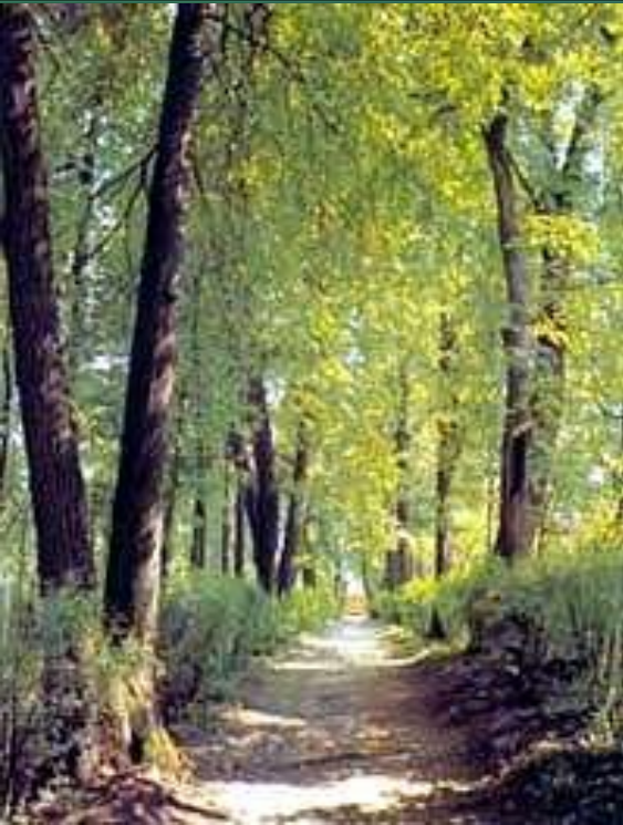
Аллея Гоголя в Абрамцеве

В 1832 году Гоголь познакомился с русским писателем С. Т. Аксаковым. С тех пор Гоголь всей душой был привязан к семье Аксаковых. Дружба их продолжалась двадцать лет, до конца его жизни. 14 августа 1849 года Гоголь впервые приехал в Абрамцево. Оно полюбилось ему.