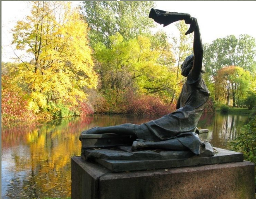
Памятник З. Портновой в Витебске