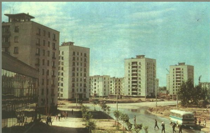
Улица Зины Портновой в Санкт - Петербурге