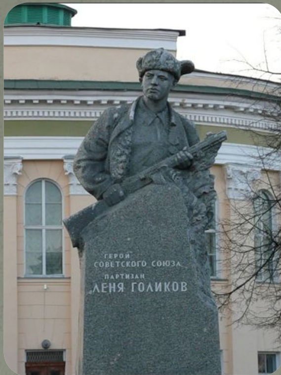
Памятник Лёне Голикову в Великом Новгороде