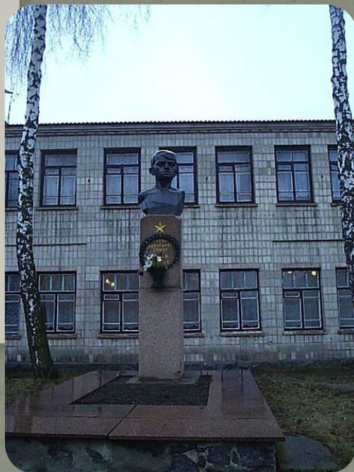
Улица В. Котика в Шепетовке