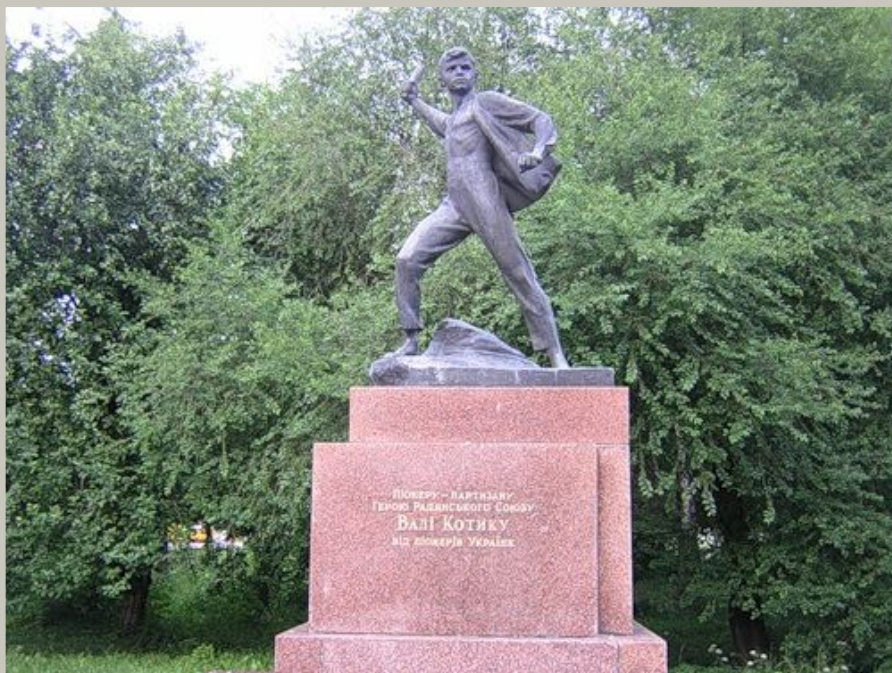
Памятник Вале Котику в Шепетовке