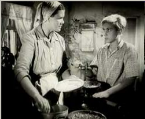
Кадр из фильма «Орлёнок»