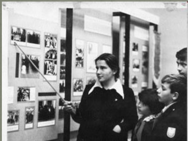
Музей В. Дубинина в школе № 1 г. Керчи