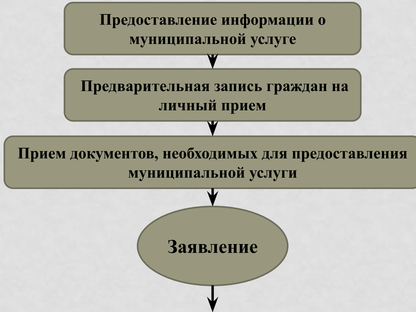
Схема предоставления муниципальной услуги