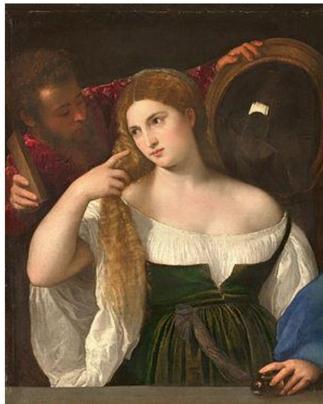
Женщина перед зеркалом