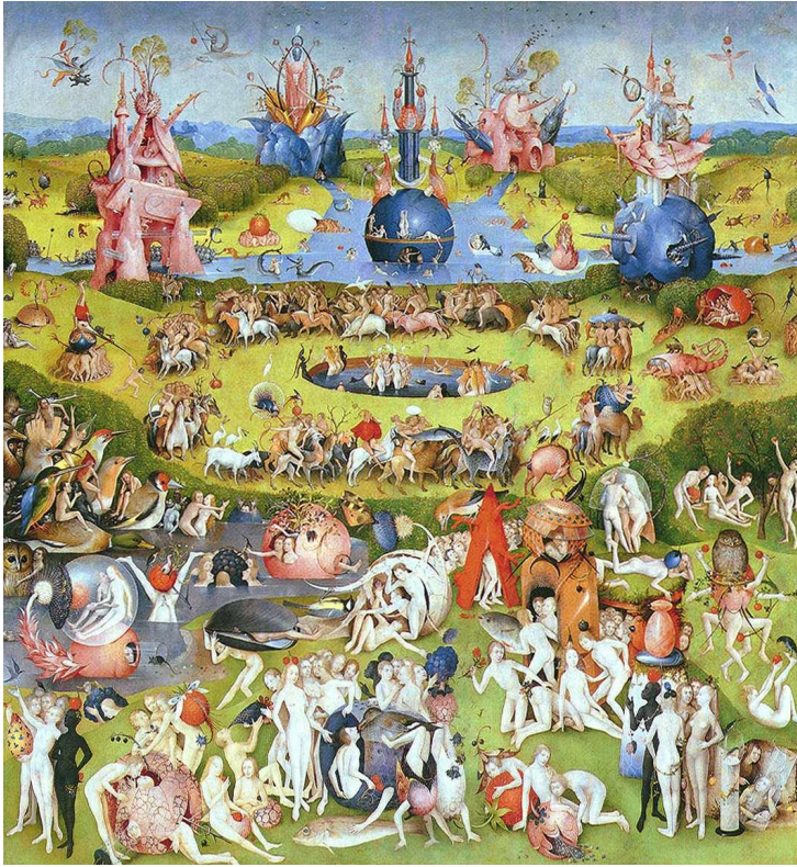
Сад земных наслаждений