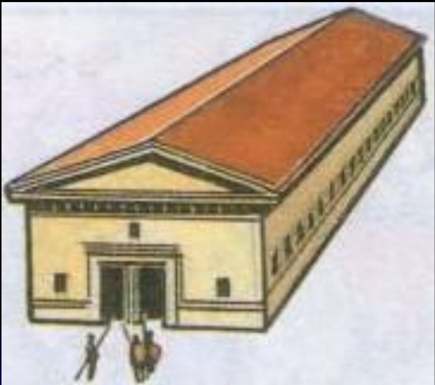
Склад в гавани