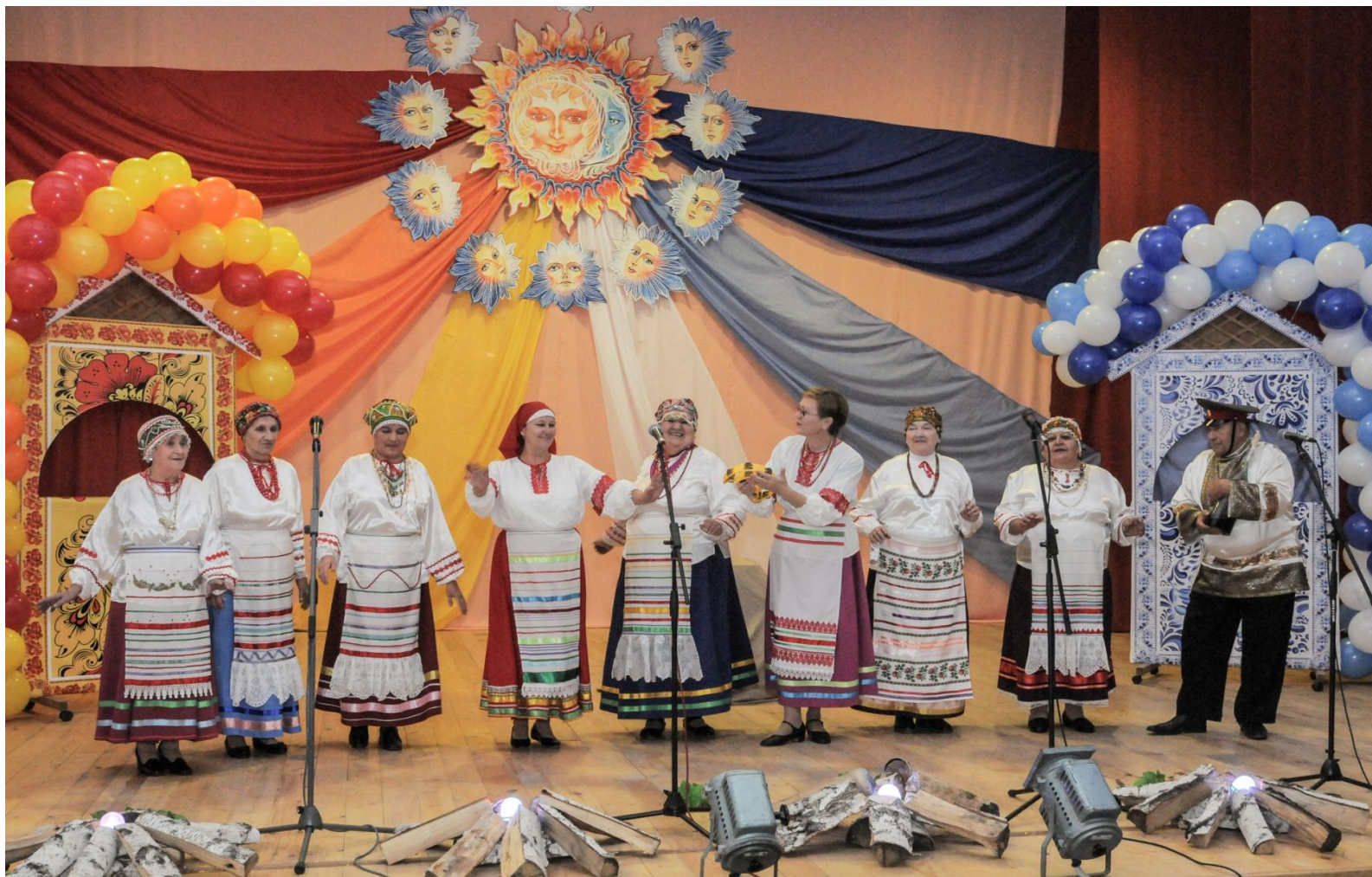
районный фестиваль творчества ветеранов «Сторона моя, сторонушка»