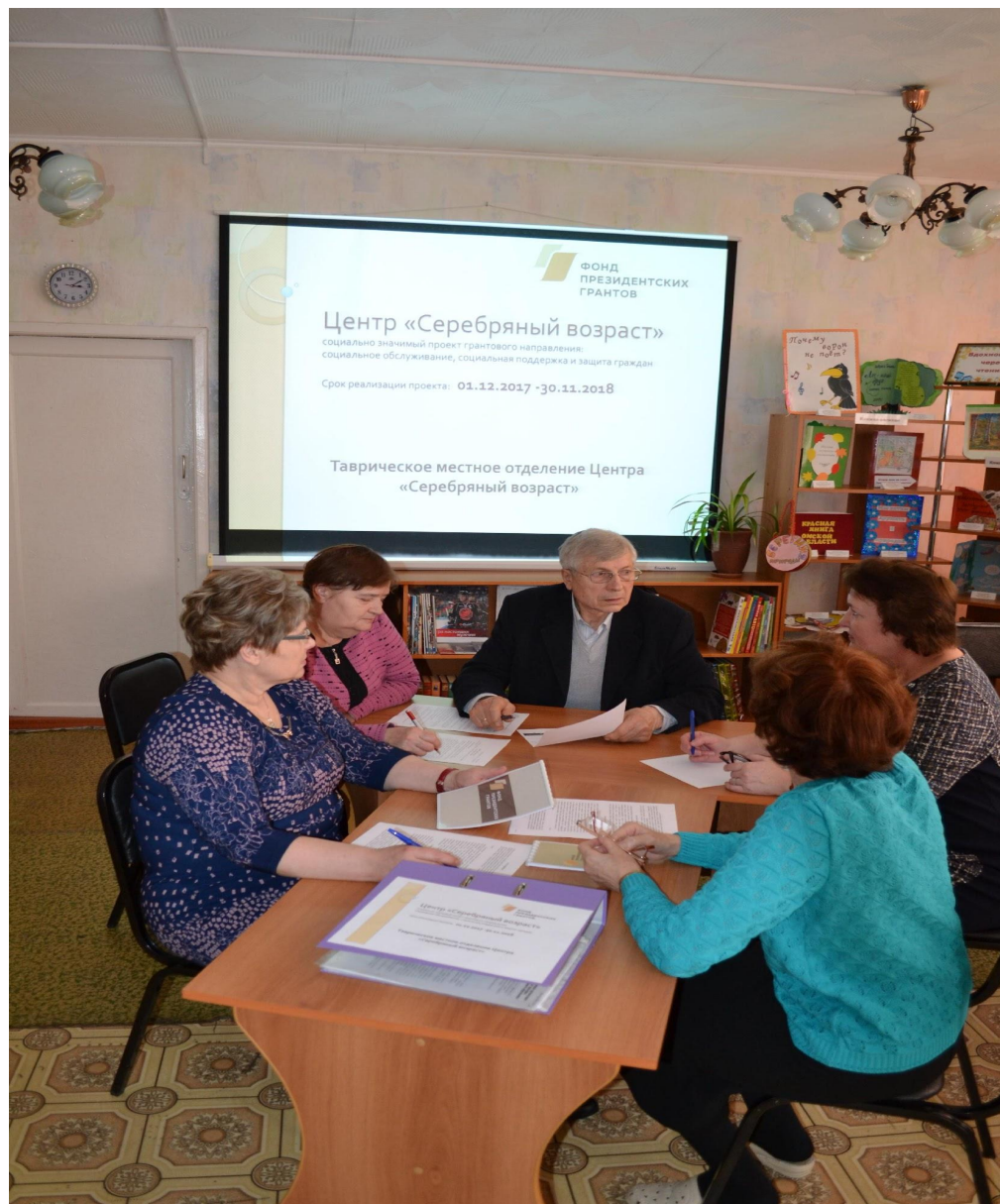
Проходит обсуждение грантового проекта Центр «Серебряный возраст»