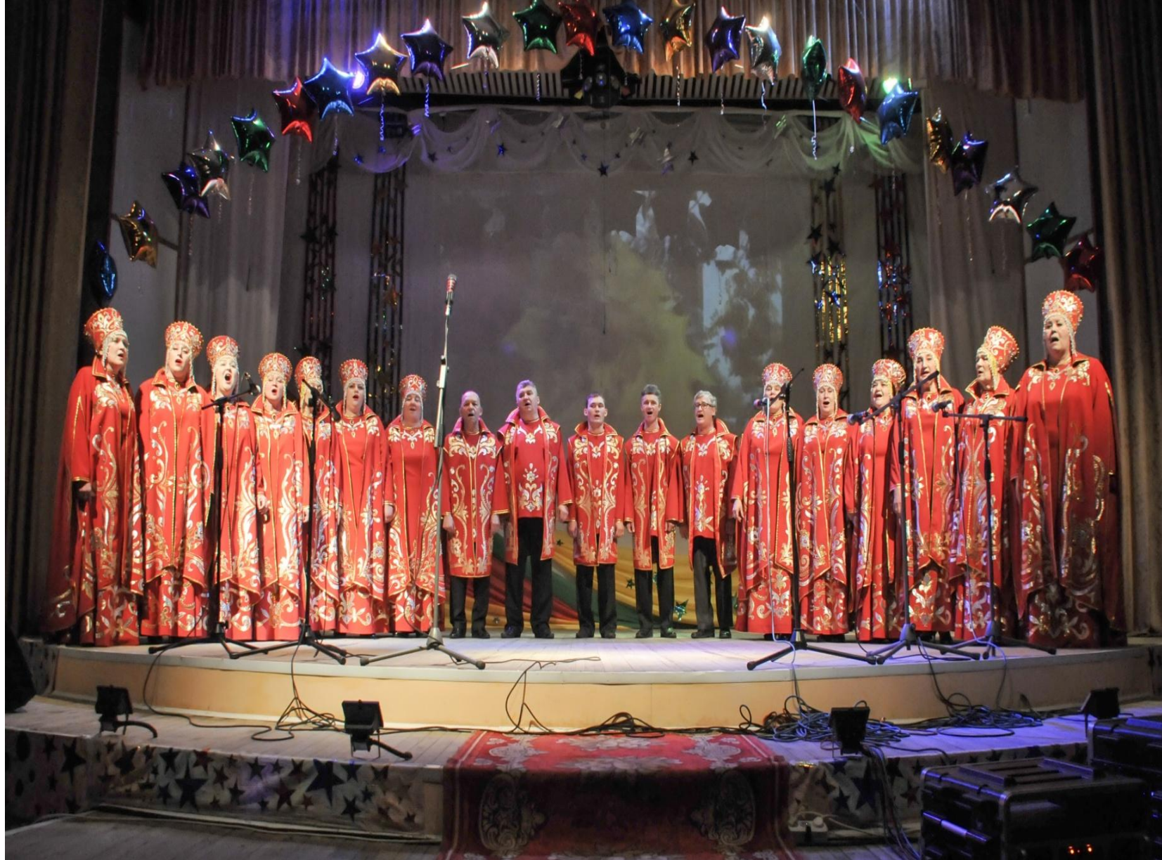
Праздничный концерт к 83-ой годовщине со дня образования района