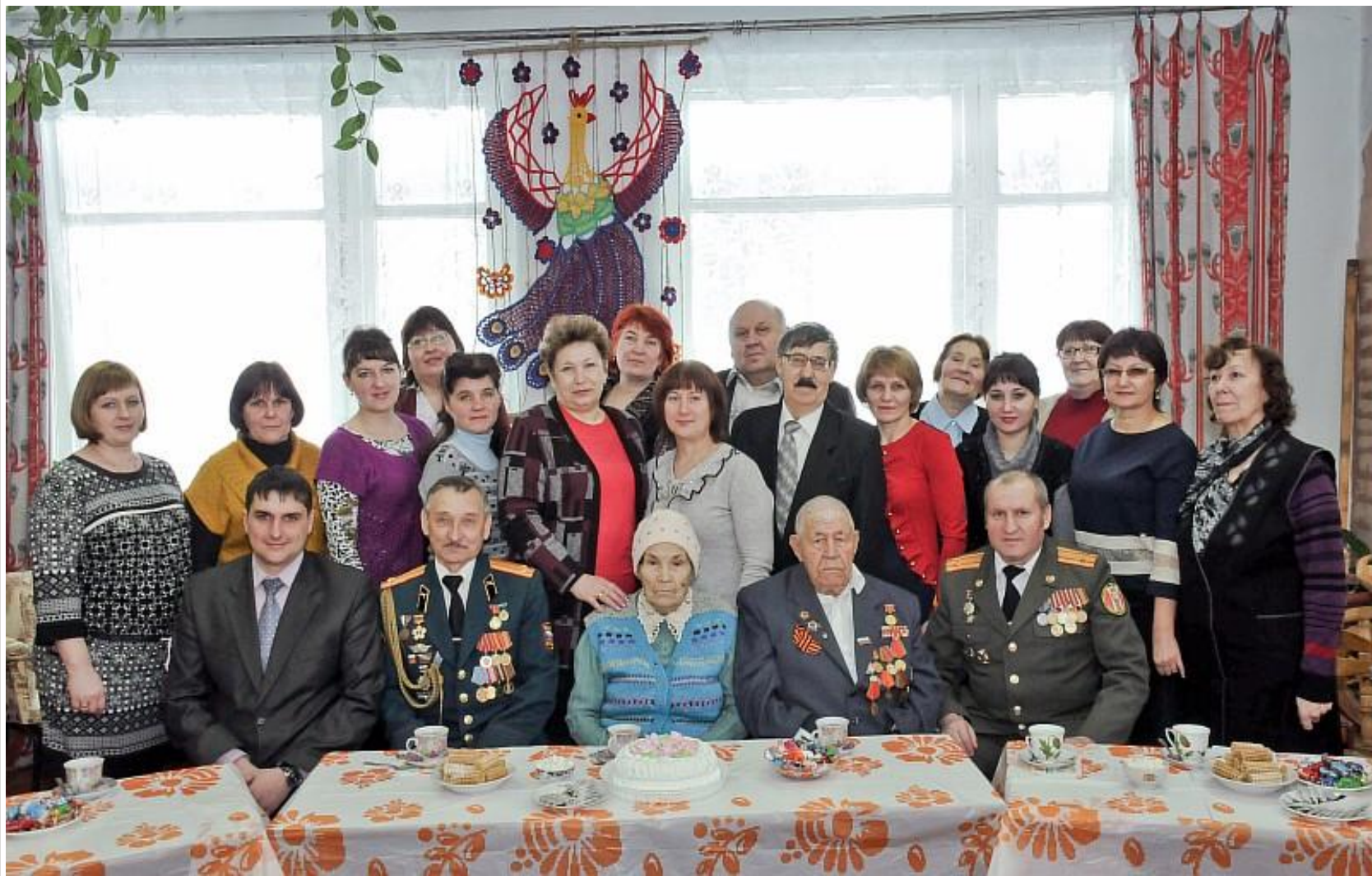
Встреча трех поколений к 83-ой годовщине со дня образования района