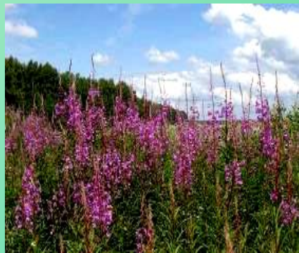
кипрей (Иван-чай) кислица