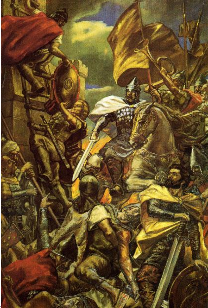
А.Клименко. Триумф князя Олега.