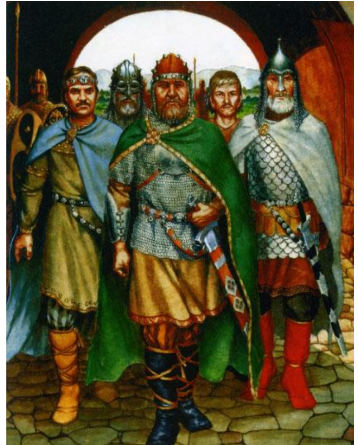
Послы русов. Ю.Лазарев.