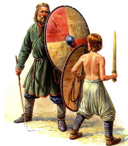
Обучение мальчика обращению с мечом и щитом