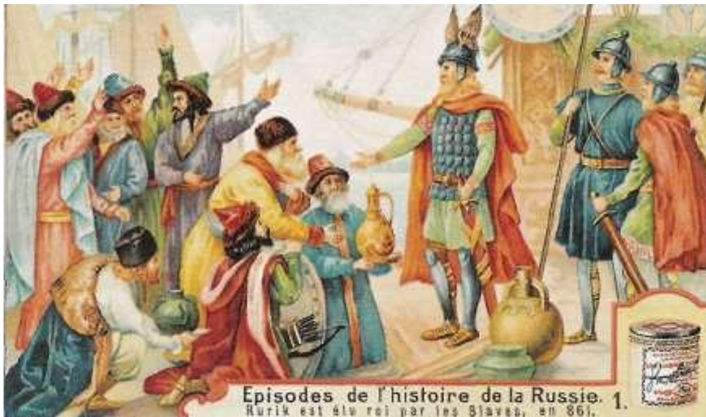
Episodes de l'histoire de la Russie. 1. Rurik est élu roi par les Slaves, en 861.