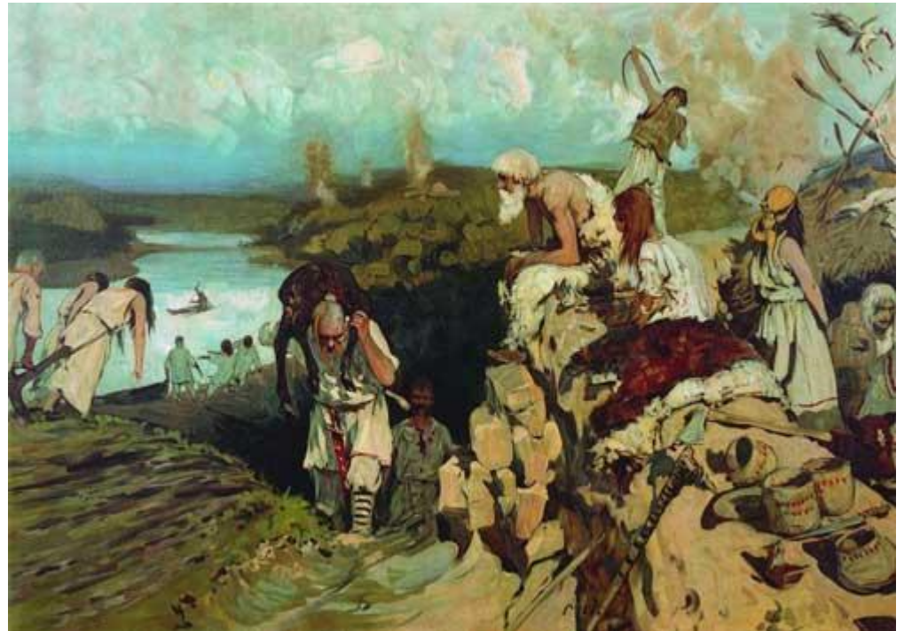
Жильё восточных славян. С.В.Иванов.

Выделяются два основных класса — крестьяне (прежде всего смерды) и феодалы .