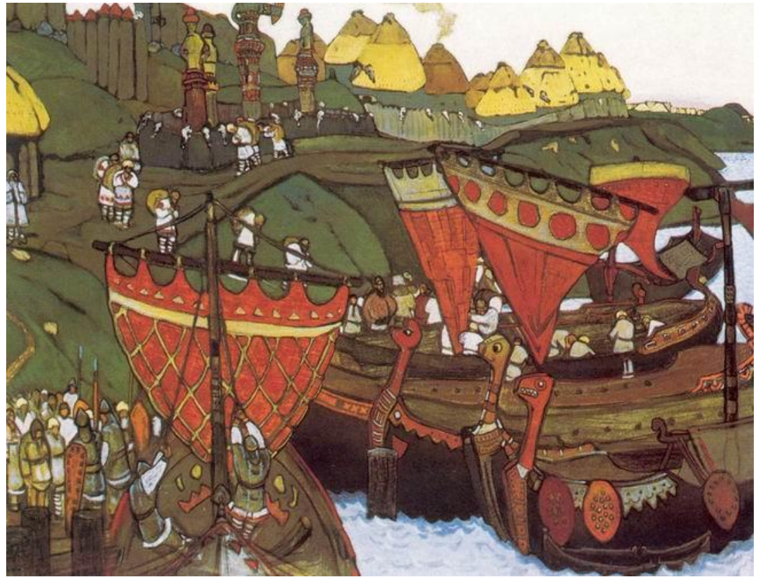
Славяне на Днепре.

Религия восточных славян (в тетрадь выписать основных богов славян и их краткую характеристику)