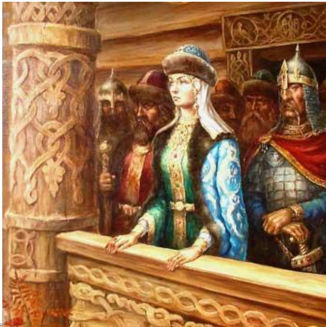
Княгиня Ольга и дружина.