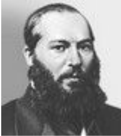
Афанасий Афанасьевич Фет (1820 – 1892) — русский поэт- лирик