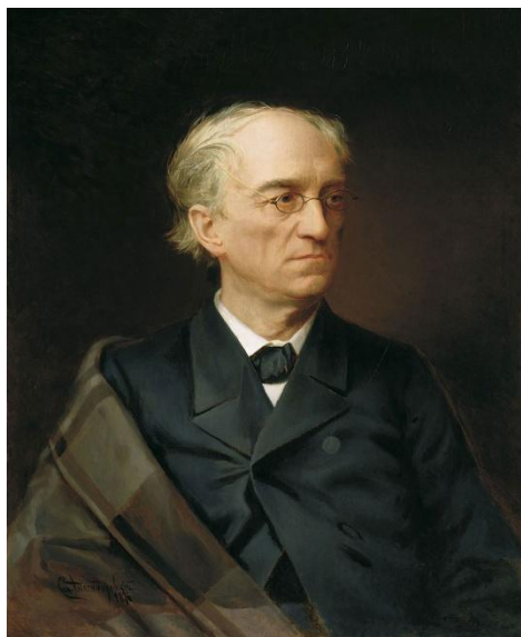
Фёдор Иванович Тютчев (1803 — 1873) — русский лирик, поэт-мыслитель