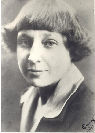
Марина Ивановна Цветаева (1892 - 1941) — русская поэтесса Серебряного века