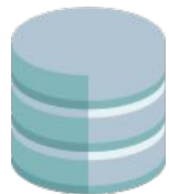
База данных предприятия