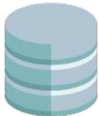
База данных соискателей