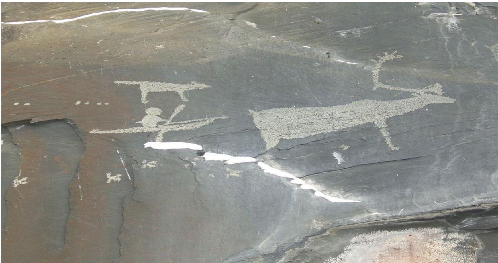
Рисунок на реке Пегтымель