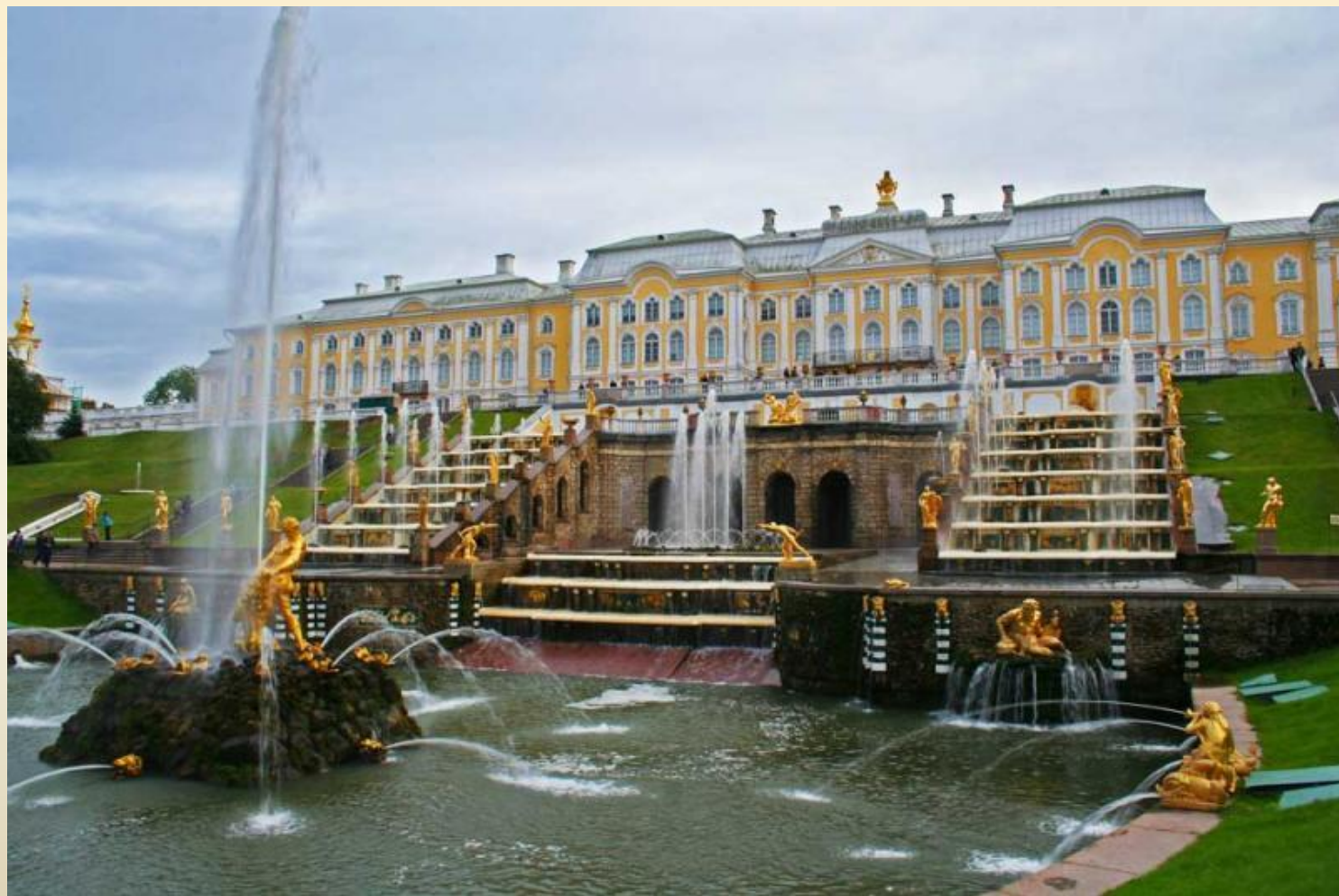
Петергоф. Дворец в стиле барокко и фонтаны.