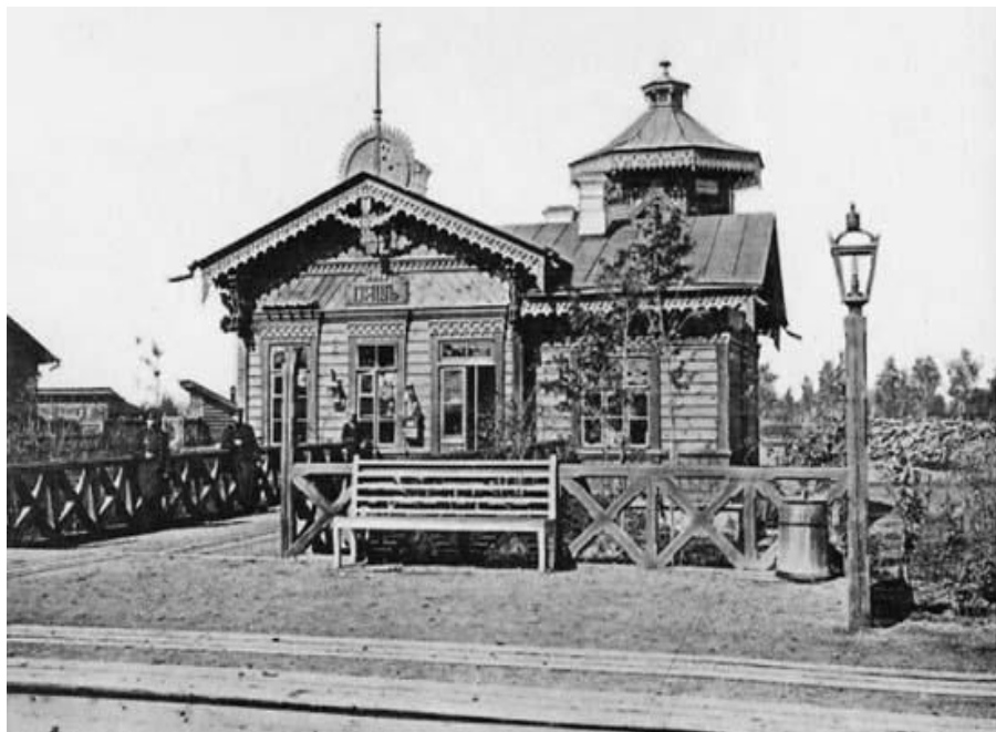
Рис.-5 Станция Ояш. Новосибирская обл.

На не больших станциях вокзалы строились деревянными, с обилием прорезной резьбы по дереву, что делало их весьма нарядными.