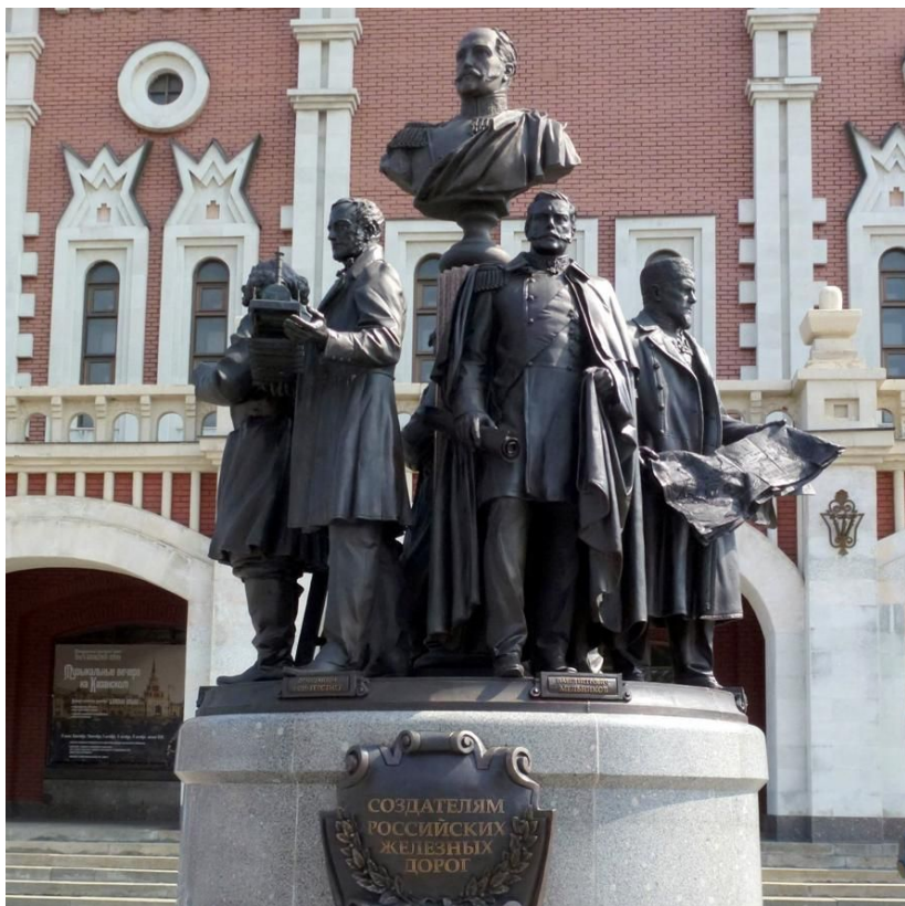
Рис.-6 Памятник у царской башни Казанского вокзала. г. Москва

Памятник представляет собой гранитный постамент, на котором расположена групповая скульптурная композиция. Центральное место занимает бюст императора Николая I на постаменте – при нём в России было начато строительство железных дорог и уложено около 1000 верст железнодорожного полотна. Окружают его фигуры выдающихся деятелей, с чьими именами связано развитие железных дорог в России: Франца Антона фон Герстнера, Павла Мельникова, Михаила Хилкова, Ефима и Мирона Черепановых, Сергея Витте. Автор памятника – народный художник России Салават Александрович Щербаков.