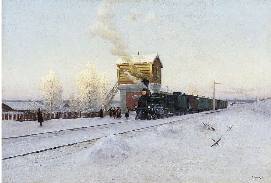
Рис.2 В. Казанцев. На полустанке

Картина Владимира Казанцева «На полустанке. Зимнее утро на Уральской железной дороге» написана в 1891 году. Ее поистине можно считать историческим документом: так выглядели первые вокзалы. Пейзаж получился очень жизненным. Художнику удалось передать настроение холодного солнечного уральского утра. На полустанок прибывает товарный состав. На перроне – горстка встречающих. Вероятно, это единственный способ доставки продуктов для местных жителей. Чувствуется мороз... Заиндевевшие деревья красуются в огороженном привокзальном палисаднике. Облаком дыма, устремляющегося в небо, приветствует их прибывший паровоз.