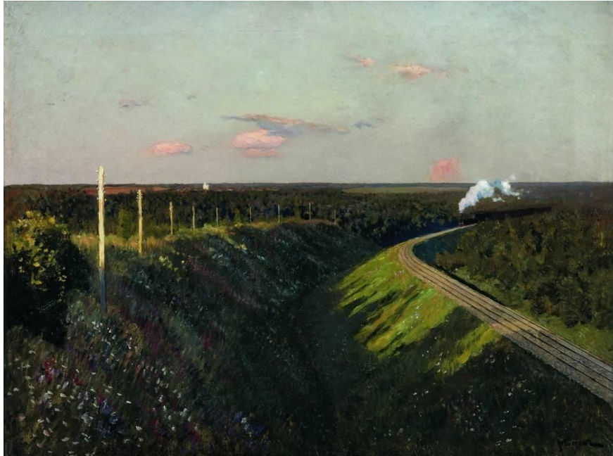
Рис.1 И. Левитан. Поезд в пути

На картине изображен товарный состав, увлекаемый паровозом. Поезд движется из глубины картины на зрителя; этот необычный ракурс создает ощущение полной сопричастности происходящему, так называемый "эффект присутствия". Пригорок, по которому движется поезд, покрыт густой зеленой травой и усыпан мелкими цветами, синими и белыми. Под насыпью, по которой проложены рельсы — глубокий овраг; телеграфные столбы, повторяя изгиб дороги, придают произведению законченность и особый ритм.