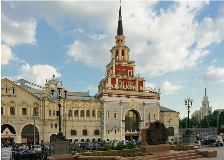
Рис.-4 Казанский вокзал. г.Москва

В 1913 году архитектору Алексею Щусеву поручили строительство нового здания Казанского вокзала. Проект был непростой, его реализация затянулась — строительство закончили лишь в 1940 году. Архитектурный облик вокзала выдержали в не о русском и восточном стилях: это было асимметричное здание с многоярусной угловой башней, выстроенной в духе башни Сююмбике Казанского кремля.