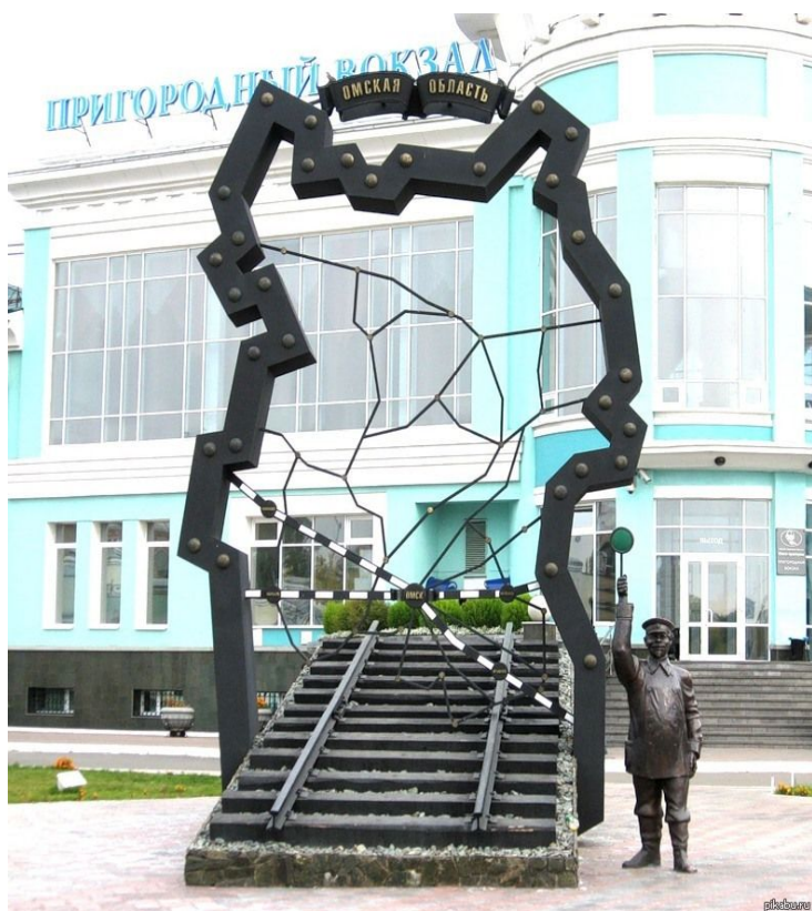
Рис.-7 Памятник железнодорожнику г. Омск

Памятник расположен в Омске на площади перед пригородным вокзалом. Открыт в 2007 году в честь 170-летия железных дорог России и 110-летия Транссибирской магистрали.