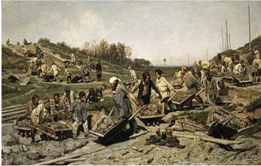
Рис.3 К. Савицкий.