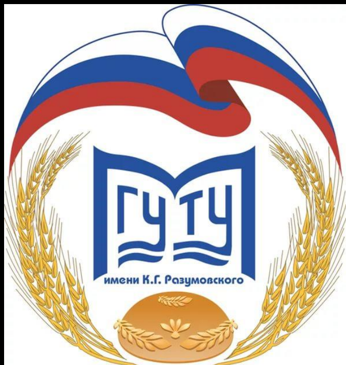
МГУ Технологий и управления