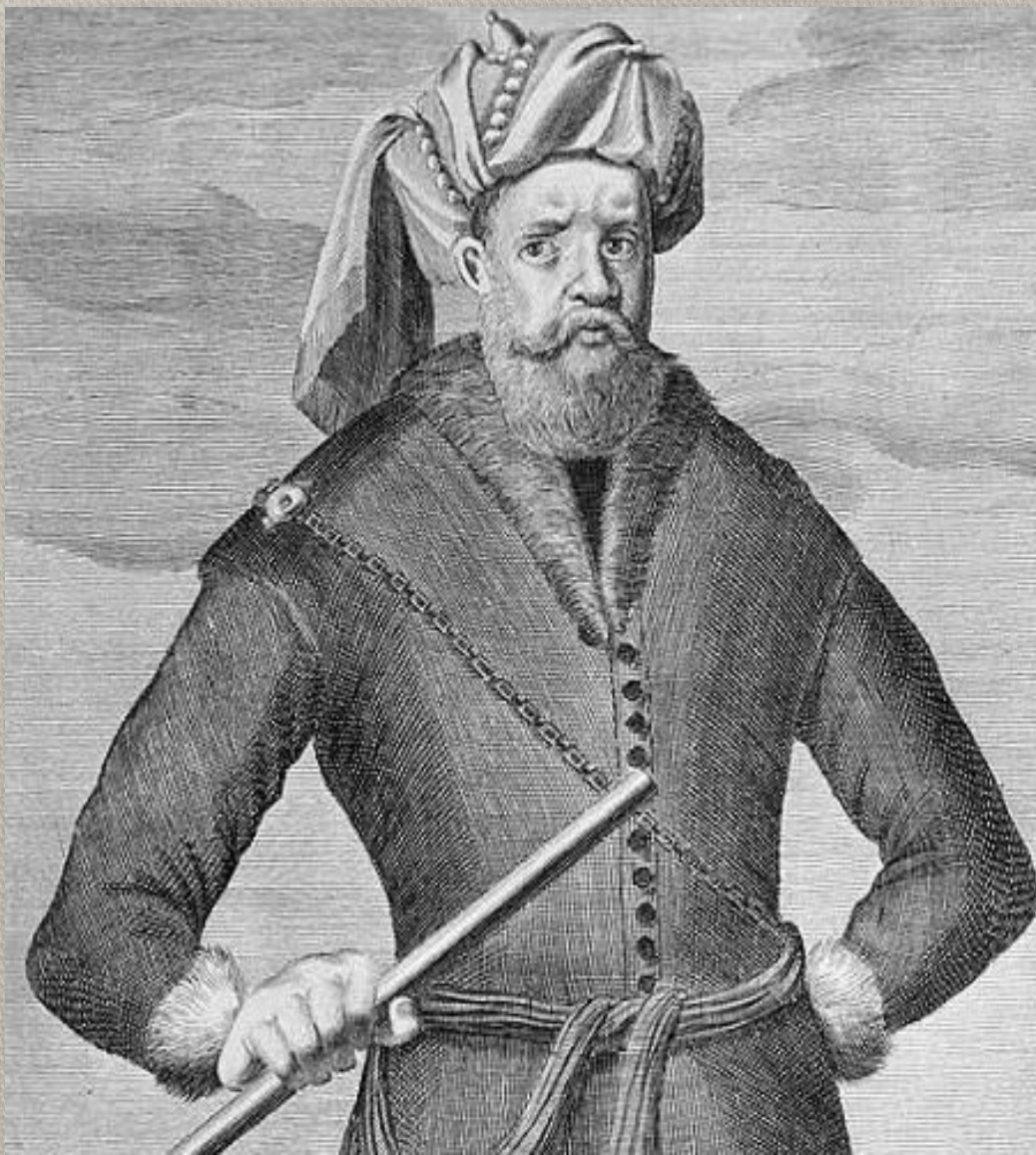
Разин. Фрагмент немецкой гравюры. 1671 г.