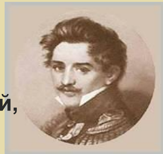
Сергей Григорьевич Волконский,