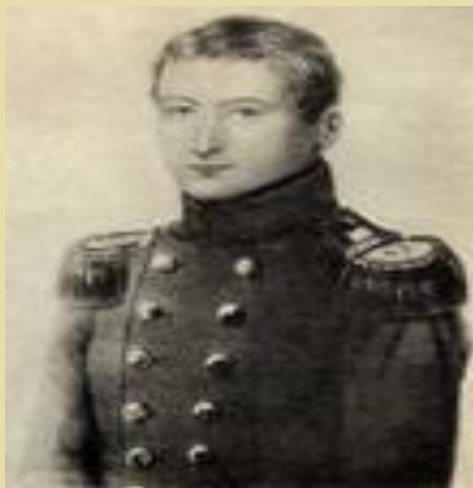
Сергей Иванович Муравьев – Апостол,