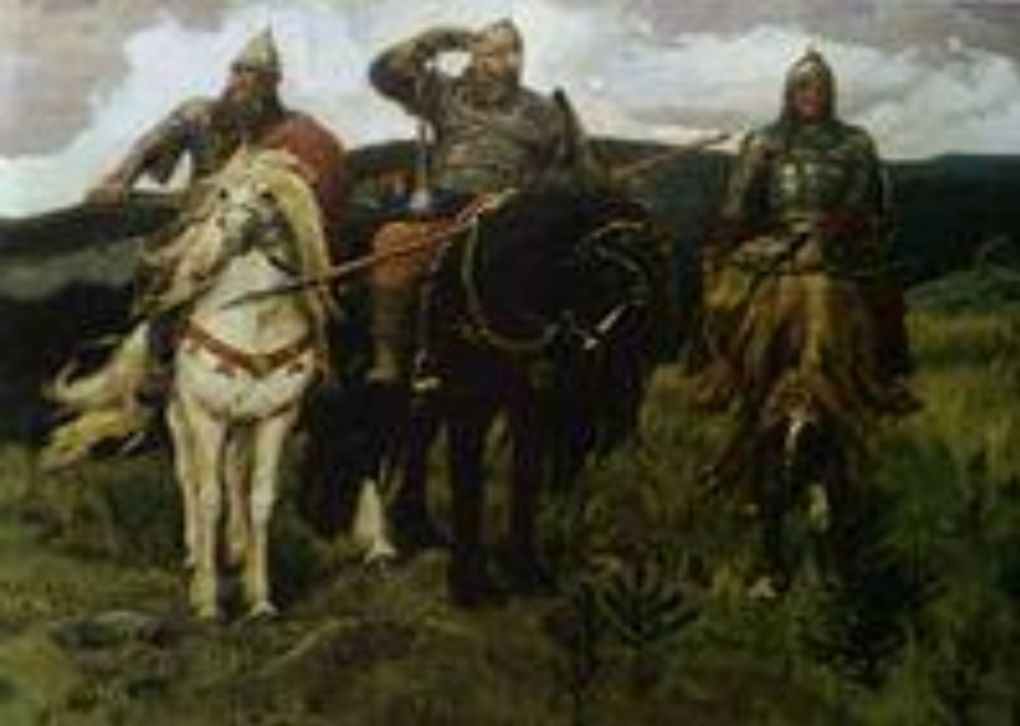
В. Васнецов “Богатыри”