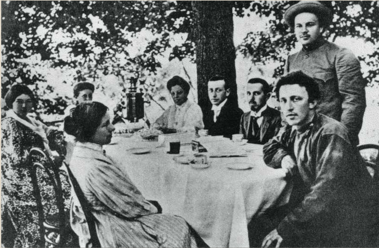
Александр Блок (справа) с семьей на отдыхе Alexander Blok Шахматово, 1909