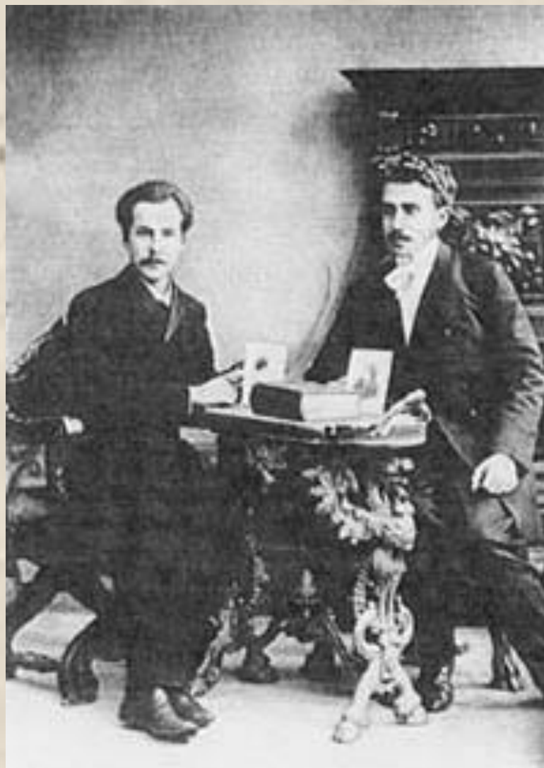
Александр Блок и Андрей Белый