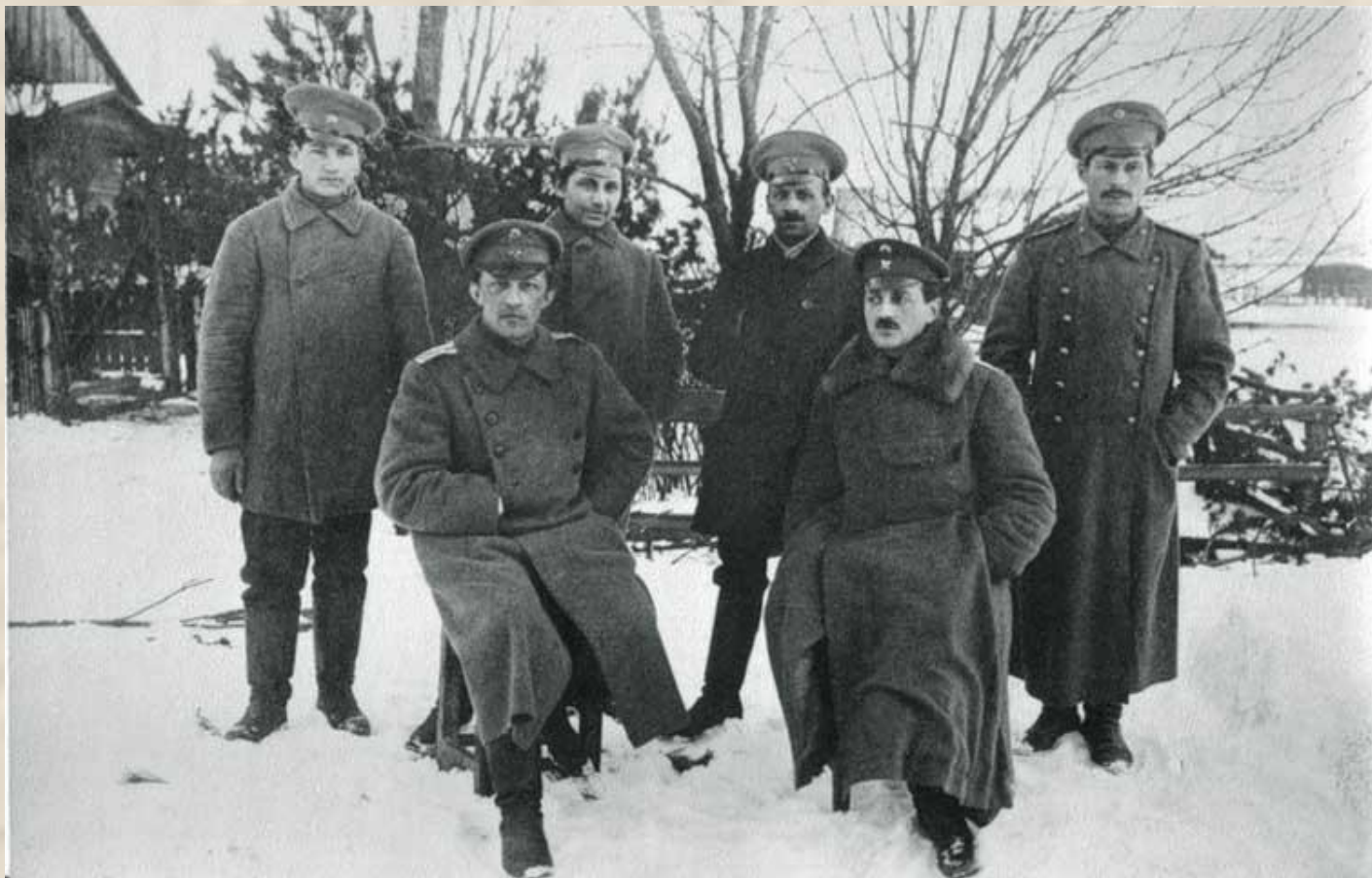
Александр Блок (сидит, слева) на военной службе Alexander Blok 1916