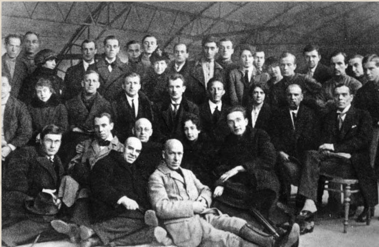
Александр Блок с артистами Большого (справа, в третьем ряду четвертый) Alexander Blok 1920