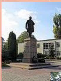
Пам'ятник в центрі села