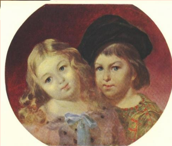
89. ПОРТРЕТ ДІТЕЙ В. М. РЕПІНА. Олія, 1—10 д. 1944.

Доля привела 17- річного Тараса до Петербурга, пишної і величавої столиці Російської імперії, до міста, де він прожив у цілому 17 років, де сталися важливі події його, де він став художником і вільною людиною.