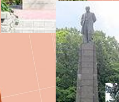
Пам'ятник на могилі поета