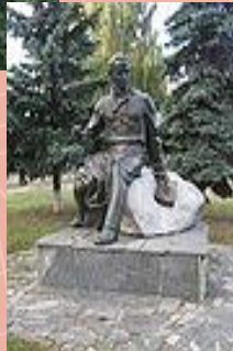
Пам'ятник у смт. Лисянці