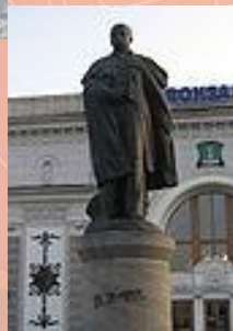
У м. Сміла біля залізничної станції ім. Шевченка