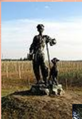
Пам'ятник малому Тарасу Шевченку-пастушку в селі