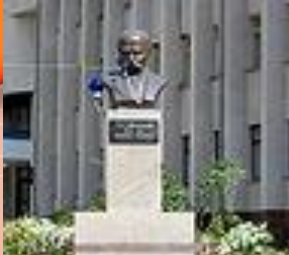
Пам'ятник у м. Кам'янка