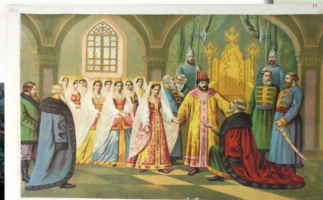
Выбор невесты Царя Алексея Михайловича. Из картин, удостоивших звание «Королева» Нарышкина.