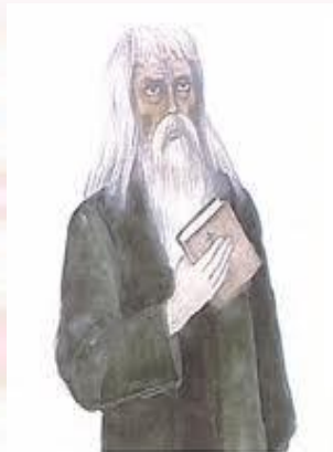
Протопоп Аввакум Петров