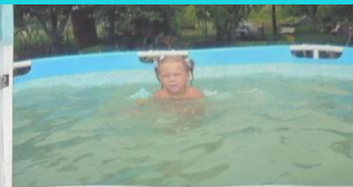
Всё лето провожаю на даче