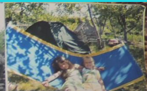
с подругой Катей.