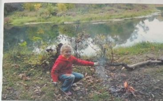
Очень люблю природу моего края!