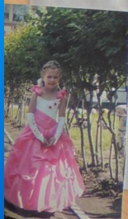
Прощай, детский сад.