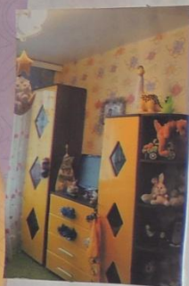
Моя детская комната.

На этих страницах представьте фоторассказ о своей малой родине. Постарайтесь в фотографиях и подписях выразить своё отношение к ней.