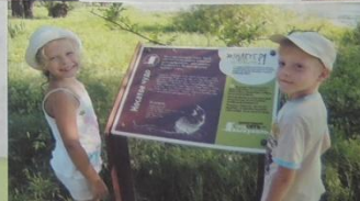
Моя дачка всегда рядом.