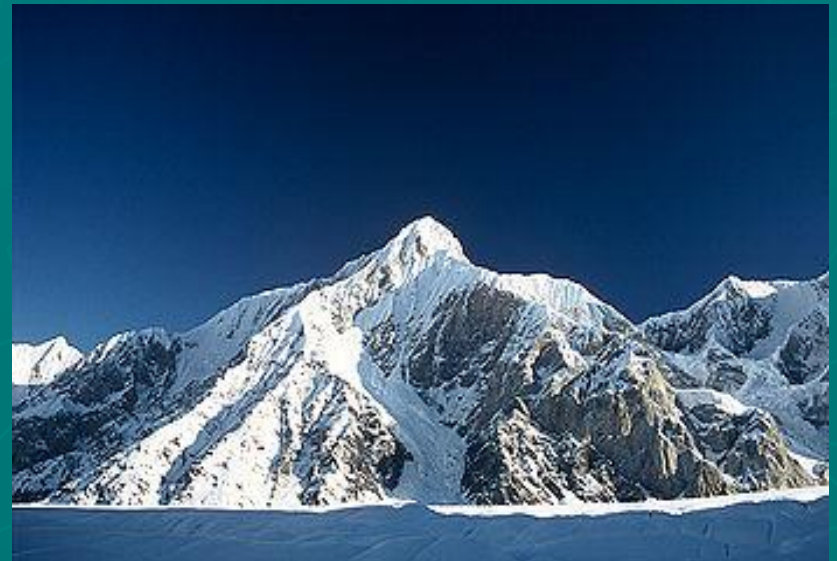
Пик Горького на Тянь-Шане