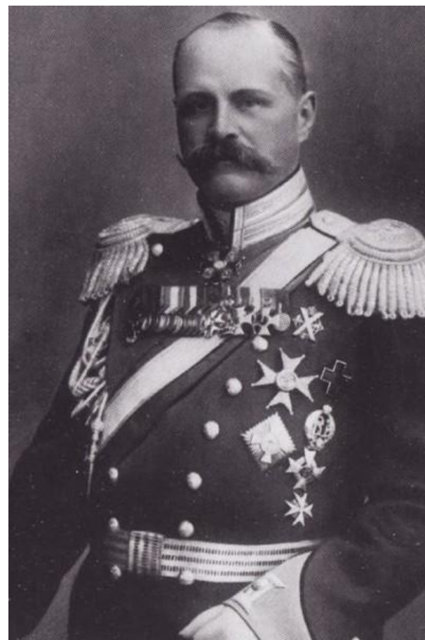
В. Ф. Джунковский