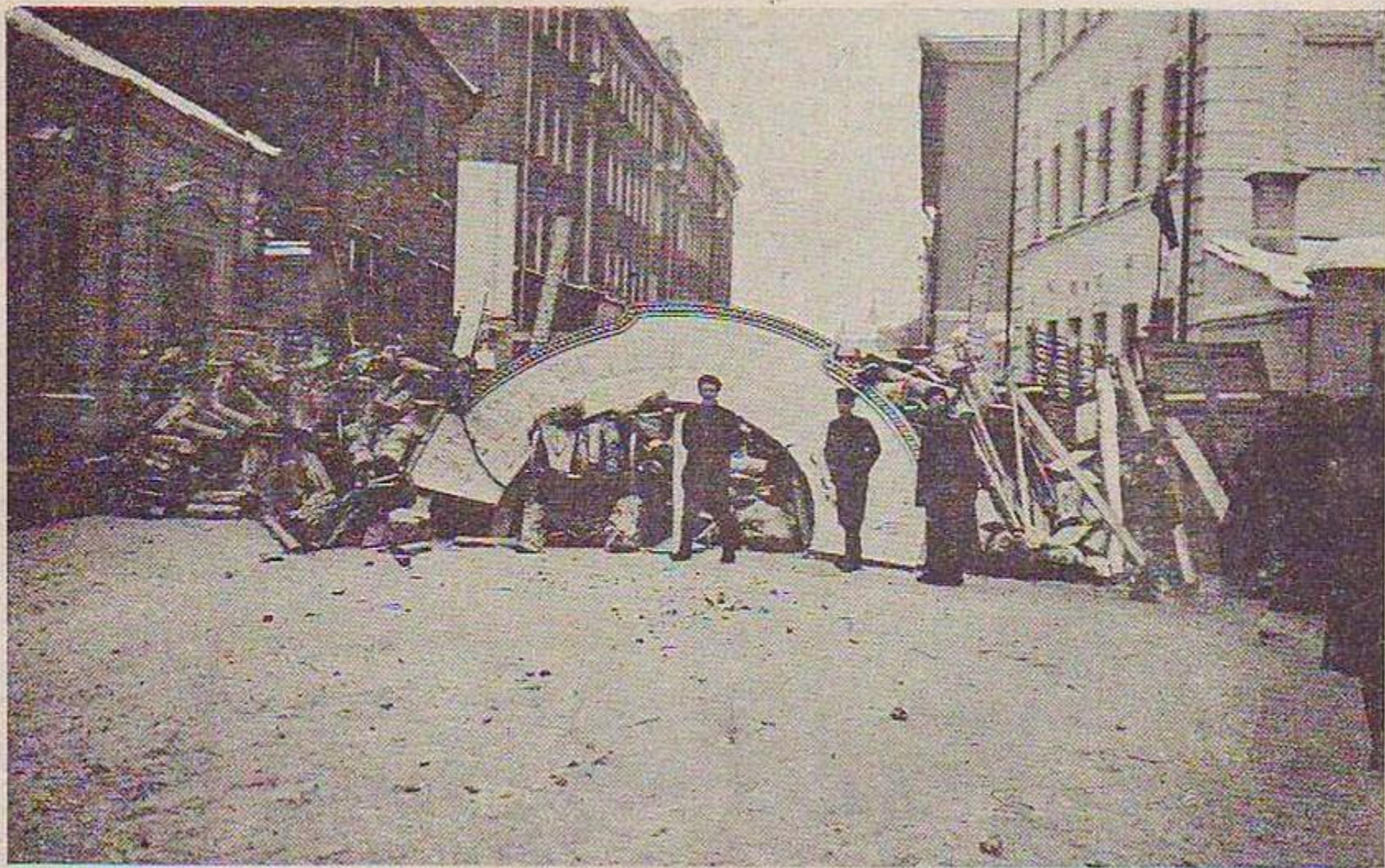
Barricades à la rue Malaya Bronnaya.