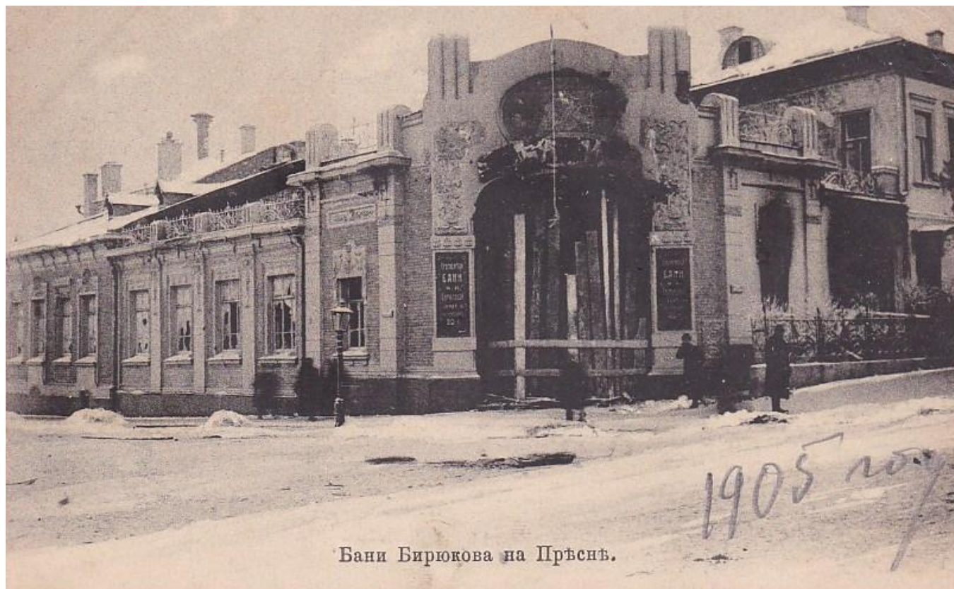
Бани Бирюкова на Прѣснѣ.

Из представителей завода «Динамо», трубопрокатного завода Гана и остальных заводов (всего около 1000 рабочих) там были сделаны дружины, милиция изгнана, слобода окружена баррикадами) и на Пресне. В банях Бирюкова пресненские революционеры организовали госпиталь. Старожилы вспоминали, что в перерывах между боями там парились дружинники, оборонявшие баррикады, которые были построены у Горбатого моста и у Кудринской площади.