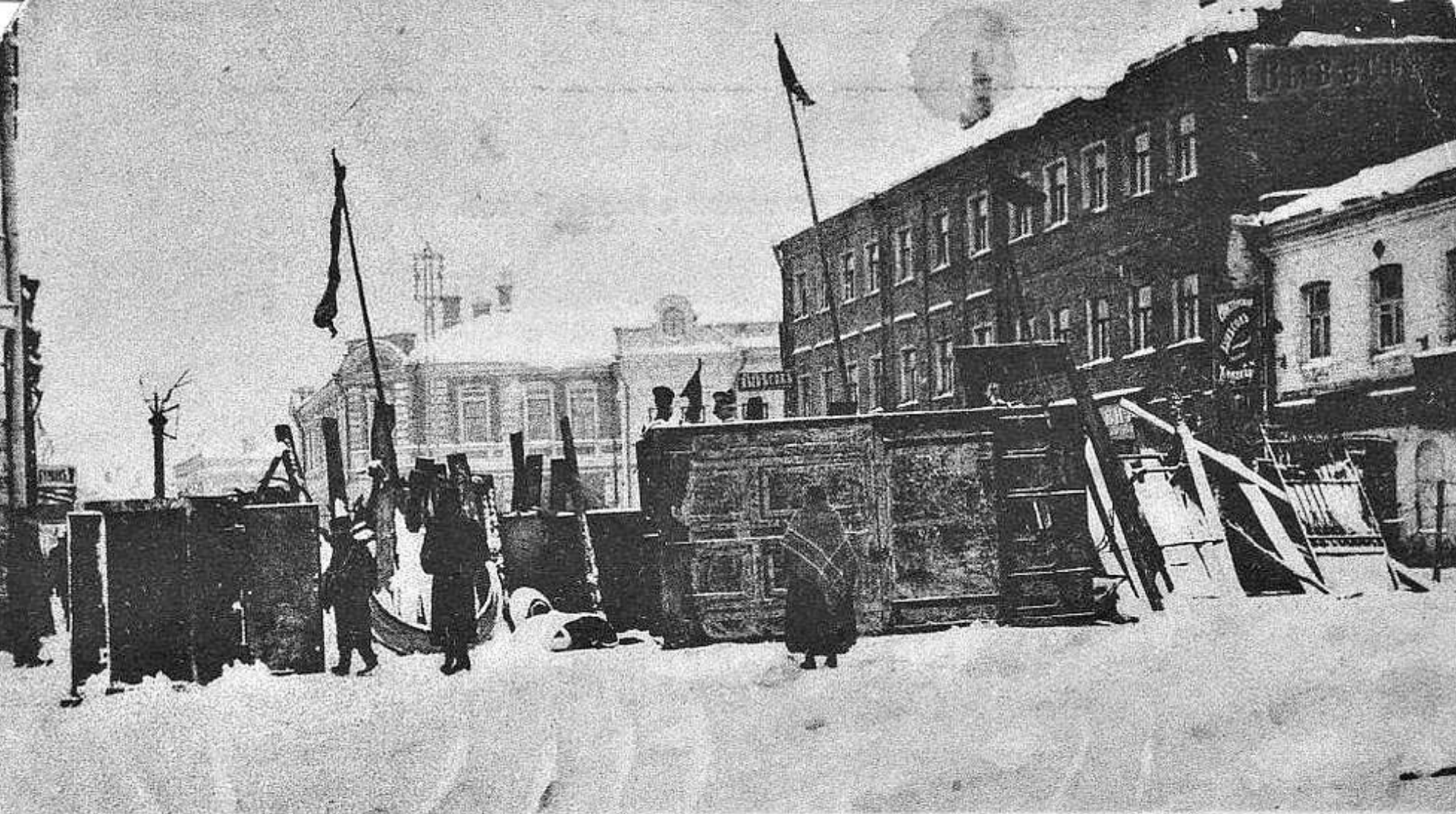
Одна изъ баррикадъ Оружейнаго переулка.