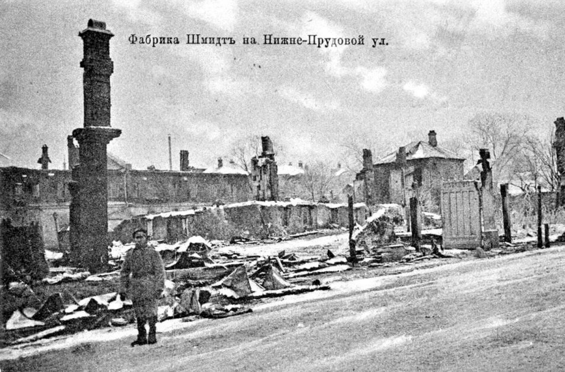
Фабрика Шмидт на Нижне-Прудовой ул.