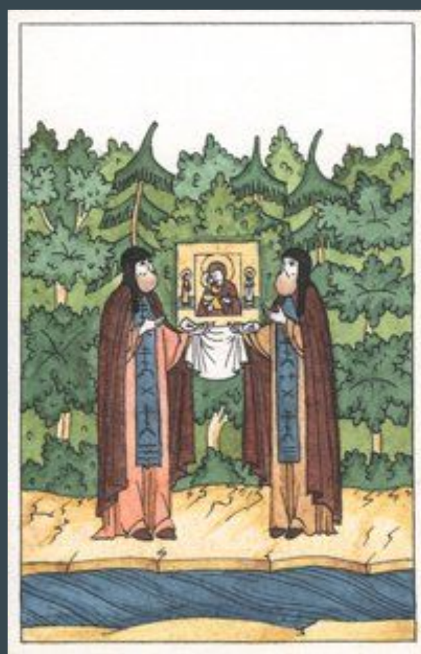
Старцы Кирилл и Герасим

Задонский Богородицкий мужской монастырь был основан в начале 17 века, около 1610 года . Два благочестивых старца-схимонаха Сретенского монастыря Кирилл и Герасим прибыли на берег реки Дон с Владимирской иконой Божией Матери и основали здесь монастырь. Первый построенный ими в 1630 году храм был посвящен Пресвятой Богородице. С этого начинается история монастыря, впоследствии обретшего славу Русского Иерусалима.