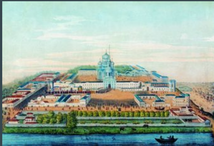
Крестный ход в день прославления святителя Тихона

В начале 19 века в монастыре осуществлялась перестройка строений. В 1845 году было начато строительство нового величественного пятикупольного восьмипрестольного трехэтажного собора в честь Владимирской иконы Божией Матери. При постройке этого храма и разборке старого в 1846 году были обретены нетленными мощи святителя Тихона. В 1861 году 13 августа состоялось его прославление.