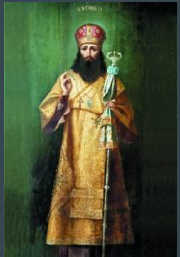
Святитель Тихон Задонский

Скромную задонскую обитель ждало новое прославление. В 1769 году сюда переселился на покой, оставив Воронежскую кафедру, святитель Тихон.