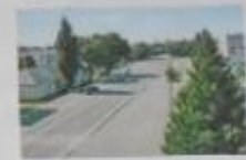
ул. Красная в центре Тынды