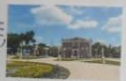
Администрация Тынтинского сельского поселения