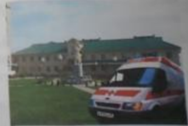
Красноярский районный дом.