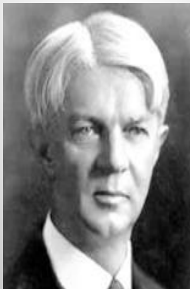
Уильям Херд Килпатрик