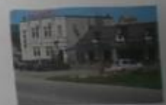
Костюма и кафе «Бережок»