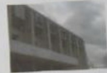
«Тинтинский дом» - это ЖИЗНЬ!