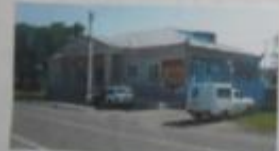
Аптека, аптека Куданце