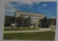
ВЛАСТЬ И УПРАВЛЕНИЕ

На этих страницах представьте фоторассказ о своей малой родине. Постарайтесь в фотографиях и подписях выразить своё отношение к ней. Моя родная столица - это: