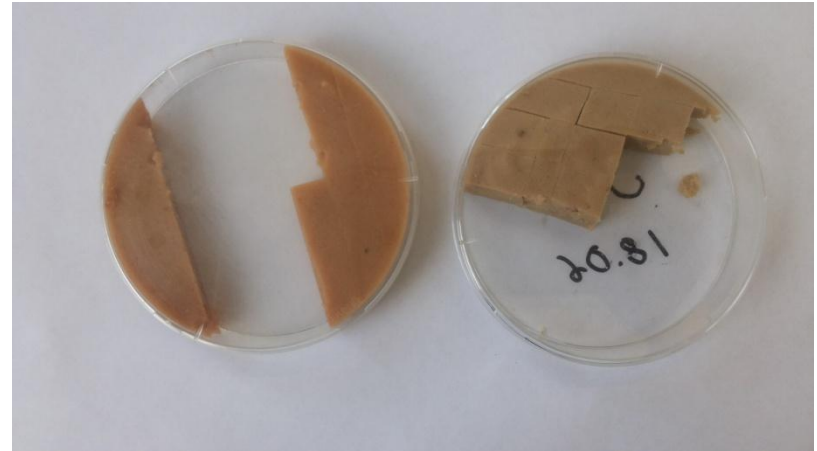
Рис.4 ИПС с дрожжевым экстрактом (слева) и ИПС с кукурузной мукой (справа)