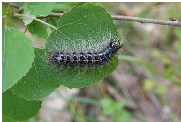
Рис.1 Гусеница НШ повреждает растение