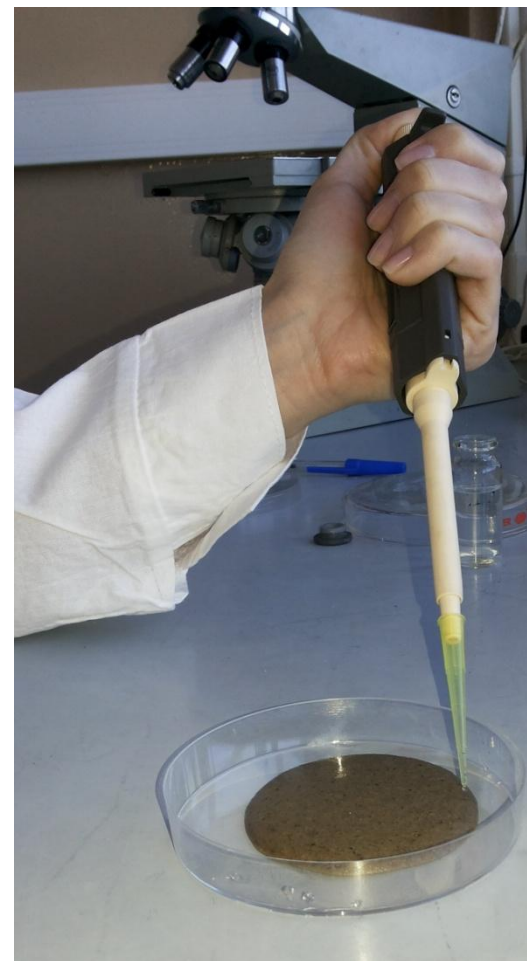
Рис.7 Нанесение вирусной суспензии