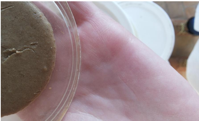
Рис.5 Край ИПС с фасолью, объединенный гусеницами НШ