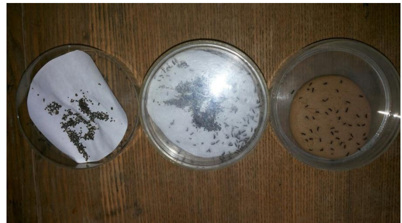
Рис.6 Этапы лабораторного культивирования гусениц НШ