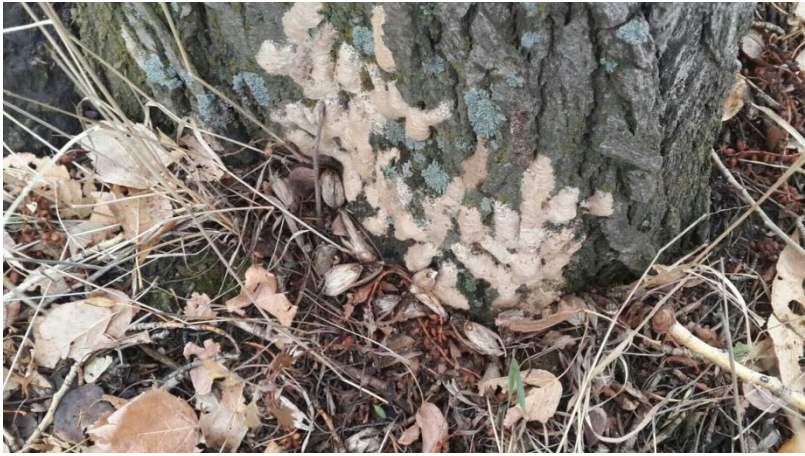
Рис.3 Грена НШ