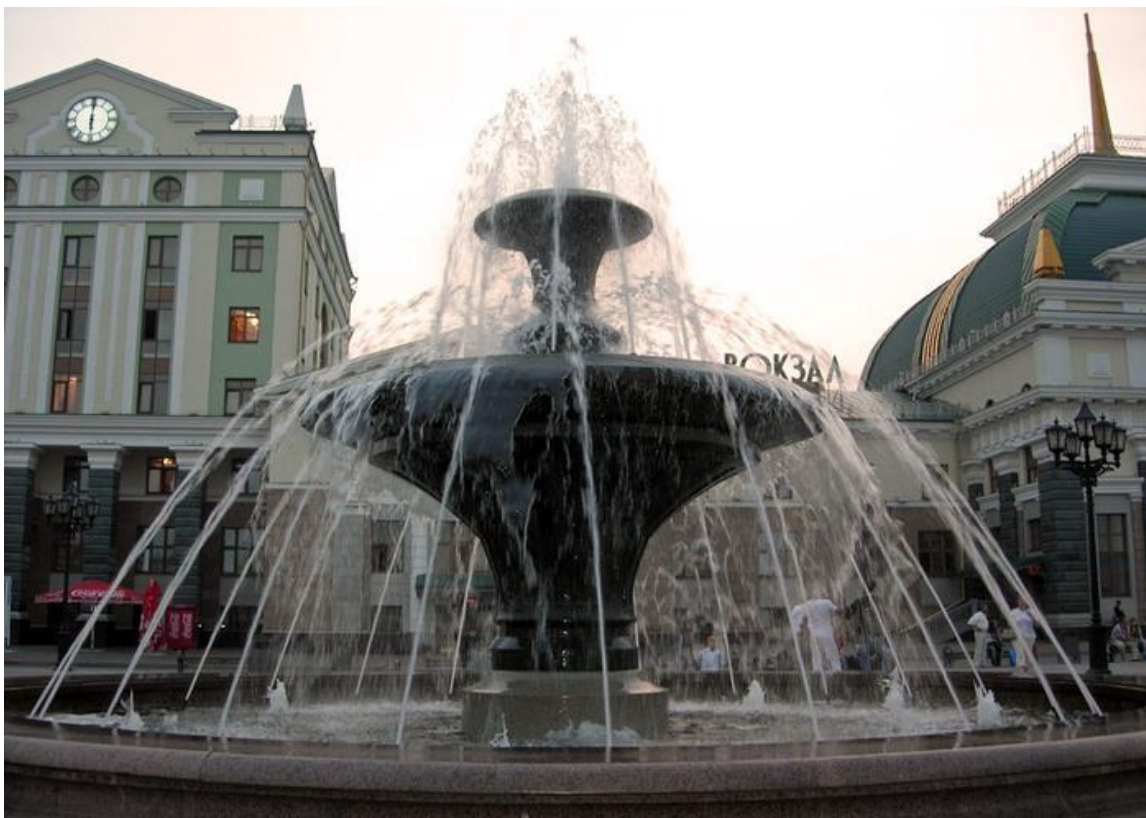
Фонтан на привокзальной площади

Ко дню города в июне 2005 года красноярцы получили еще один подарок – Привокзальную площадь. Выложена цветной брусчаткой, с 3-мя фонтанами, площадь смотрится очень нарядно, торжественно и красиво. Изюминкой площади является геральдическая колонна. Высота столба 16 метров, венчает колонну лев – символ Красноярска. В лапах льва как и на гербе города лопата и серп. Рост этого царя зверей 3,5 метра, а вес более 3000 кг. Колонна стоит в центре площади, ее окружают меняющиеся по величине струи фонтана.