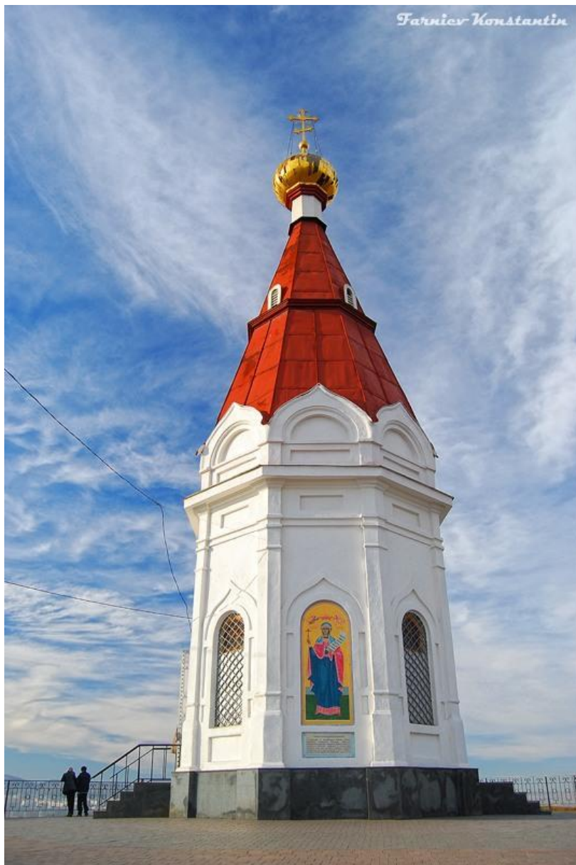
Часовня Параскевы Пятницы

С красноярской часовней знаком каждый россиянин. Ведь на 10-ти рублевой купюре на ряду с Красноярской ГЭС силуэт нашей часовни. Самый «древний» памятник истории и архитектуры нашего города обозначает памятное, историческое место, связанное с историей Красноярска. В тот день, когда ставили крест, горожане выловили в р.Кача икону Святой Великомученицы Параскевы Пятницы. Этой Святой молились о благополучии в доме, о хозяйственных нуждах, считали ее покровительницей скота и полей. Девушки молились ей о женихах. В дальнейшем, когда на месте креста появилась часовня, ей дали имя Параскевы Пятницы. По другой версии часовню называли так в честь девушки-казачки, которая собирала ягоды на склоне Караульной горы и увидев приближающихся к городу кочевые племена, подняла шум., за что и погибла мученической смертью. Параскева. В современной жизни мы не представляем свой любимый город без этой исторической достопримечательности. За время своего существования часовенка стала центром, куда любят приходить и горожане, и гости нашего города. С холма, на котором стоит часовня, виден весь город и его окрестности.