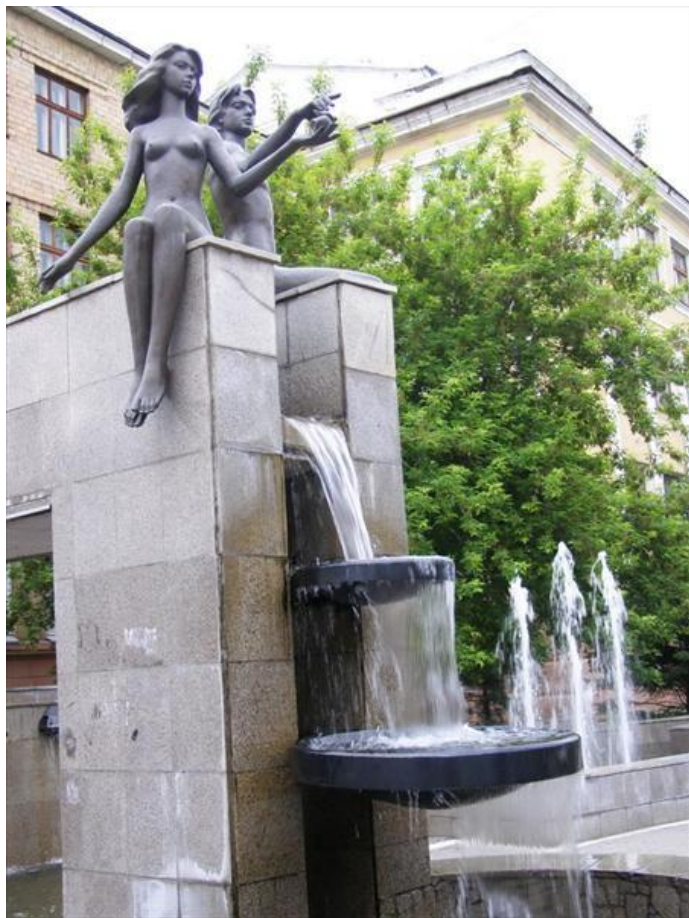
Фонтан «Адам и Ева»