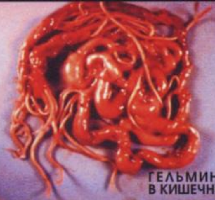
ГЕЛЬМИНТЫ В КИШЕЧНИКЕ