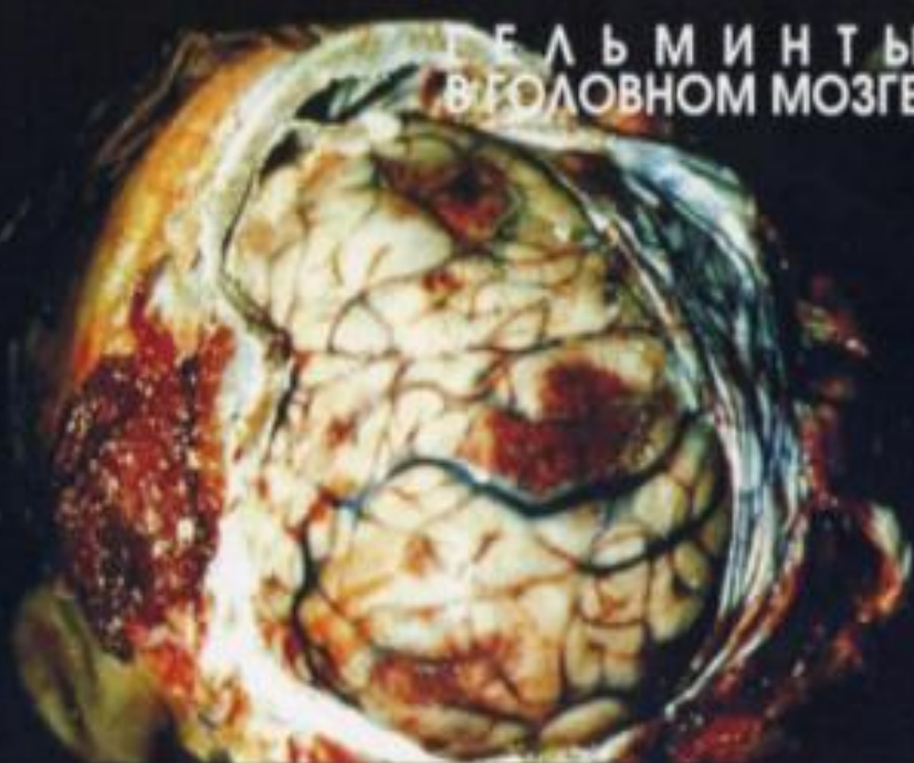
ГЕЛЬМИНТЫ В ГОЛОВНОМ МОЗГЕ