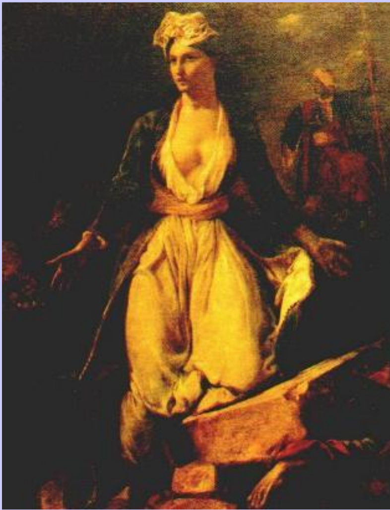
Э.Делакруа. Греческая революция

В к. 20-х г. Союз распался из-за противоречий по Восточному вопросу.