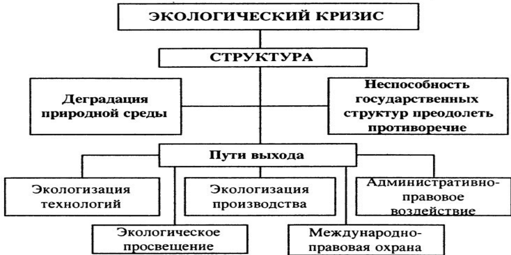
Рис. 19.1. Пути выхода России из экологического кризиса (по В. В. Петрову, 1995 г.)