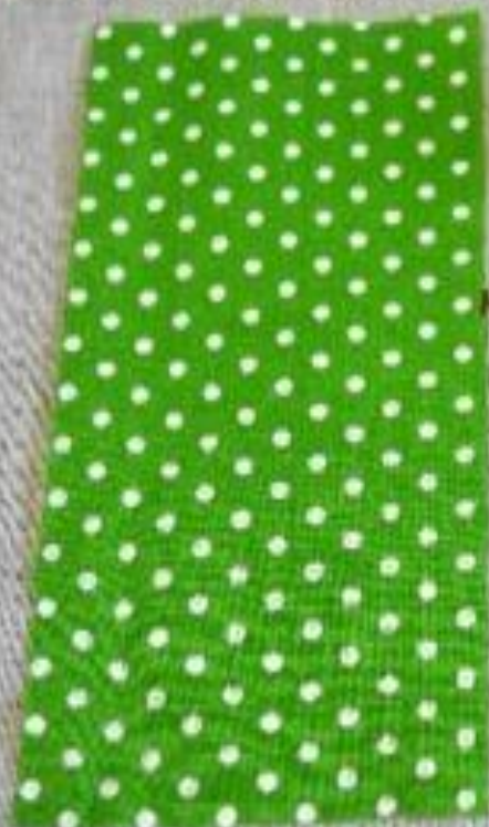
Кусок ткани (бязь или ситец)