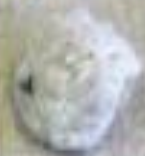
Небольшой комочек ветоши