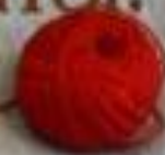
Пряжа «Красный ирис»