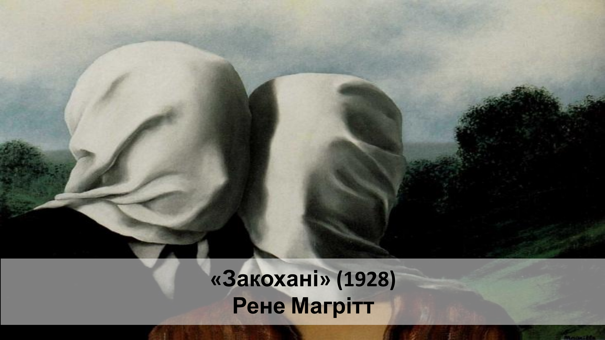
«Закохані» (1928) Рене Магрітт