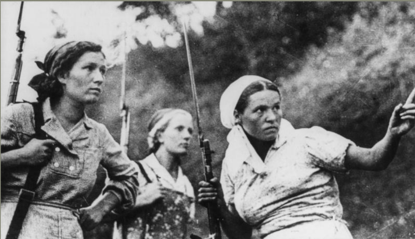
Советские женщины-партизанки, вооруженные винтовками Мосина с примкнутыми штыками.

на вооруженных партизанских отрядов преобладало легкое стрелковое оружие, автоматы, пулеметы и минометы.